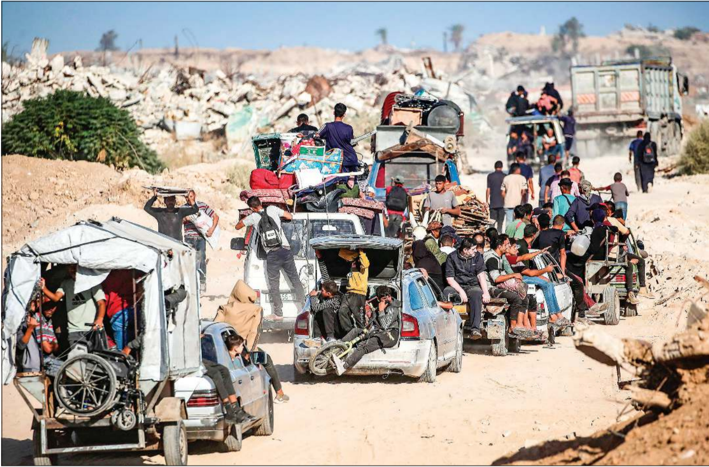
فلسطينيون يعودون إلى مدينة غزة عبر ما يسمى ممر نزارام

من جهته، أفاد المكتب الإعلامي الحكومي في غزة أن الطواقم الميدانية نفذت خلال 24 ساعة آلاف المهام الطبية والإنسانية والإغاثية، شملت إجراء عمليات جراحية وإسعاف الجرحى، وانتشال جثامين وإزالة أنقاض، وإعادة تشغيل شبكات المياه والكهرباء وفتح الشوارع المتضررة. كما أشار إلى تنفيذ مهام لوجستية وخدمية في مراكز الإيواء والمدارس، من أجل تسهيل وصول المساعدات للسكان والنازحين. وأضاف أن هذه الجهود تجري في ظل «دمار هائل»، وأدى إلى تدمير نحو 30 ألف وحدة سكنية ونزوح السكان، وسط نقص في الوقود والمياه والاتصالات والمواد الأساسية. في المقابل، أعلن الجيش الإسرائيلي أن قواته ستبقى منتشرة في مناطق محددة في قطاع غزة بموجب اتفاق وقف إطلاق النار، محذرا السكان من أن التحرك إلى هذه المناطق قبل إصدار إعلان رسمي «سيكون في غاية الخطورة». وحدد جيش الاحتلال في بيانه، طريقي الرشيد وصلاح الدين لانتقال النازحين من جنوب القطاع إلى شماله.