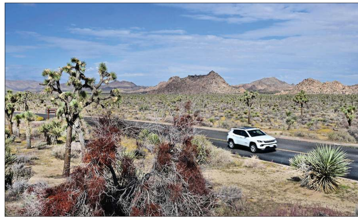
ممتازة شجرة جوشوا في كاليفورنيا مفتوح رغم الإغلاق الحكومي لكن بعض خدمات الزوار متوقفة

عندما سأله صحافيون عن النتيجة بعد عودته إلى البيت الأبيض، رفع ترامب إبهامه عاليا تعبيريا عن رضاه. وكتب طبيبه شون باربايلا في رسالة نشرها البيت الأبيض «يواصل الرئيس ترامب إظهار تمتعه بصحة عامة ممتازة». وأضاف أن «عمره القلبي، وهو مقياس معتمد لحيوية القلب والأوعية الدموية عبر إجراء تحليط، أصغر بنحو 14 عاما من عمره الزمني، وهو يواصل الالتزام بجدول يومي مرهق دون قيود». وقال باربايلا إن ترامب أجرى مجموعة من الاختبارات الروتينية وتلقى جرعة معززة من لقاح «كوفيد-19» وجرعة الإنفلونزا السنوية. وسبق للبيت الأبيض أن أعلن في يوليو أن ترامب يعاني من قصور وريدي، بعدما نشرت صور له ظهرت فيها كدمات على يديه. وأوضح البيت الأبيض حينها أن الكدمات نتيجة «المصافحة المتكررة» وتناول الرئيس الأسبرين «كجزء من وصفة وقائية لأمراض القلب والأوعية الدموية». وفي سياق صحي آخر، أعلن الرئيس الأميركي عن اتفاقية مع شركة «أسترازينيكا» البريطانية الدوائية، قال إنها ستففي إلى خفض كبير لأسعار الأدوية المحلية مقابل منح عملاق صناعة الأدوية إعفاء ضريبيا. وبموجب هذا الاتفاق، الذي يأتي عقب اتفاق مماثل أعلن عنه الشهر الماضي مع شركة «فايزر» الأميركية العملاقة، تقوم شركة «أسترازينيكا» بتقديم أسعار تراعي قاعدة «الدولة الأكثر رغبة»، وهي قاعدة تفرز على أسعار المنخفضة في الولايات المتحدة بأدنى أسعارها في الدول الغنية