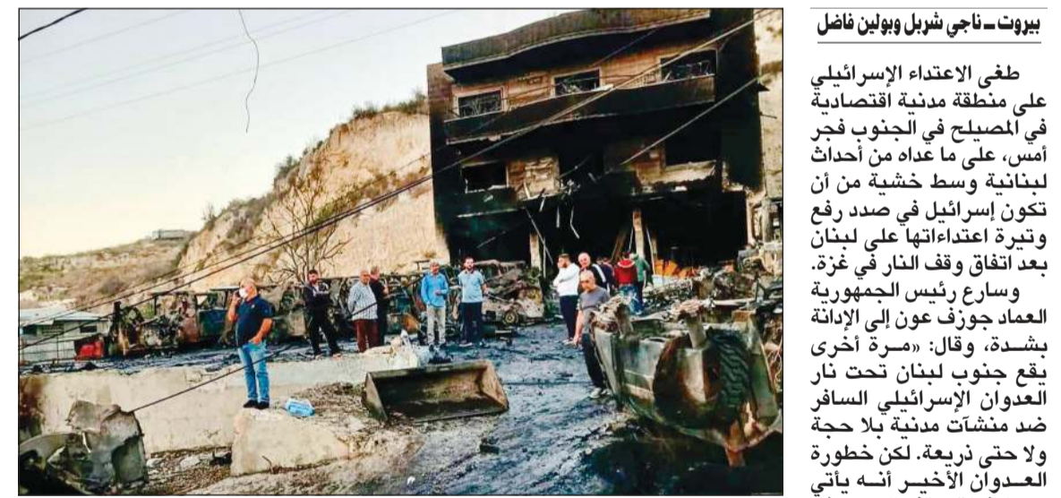
آثار الدمار جراء غارات إسرائيلية استهدفت معارض للجرافات والحفارات في المصليح جنوب لبنان

بيروت - ناجي شربل وبولين فاضل طغى الاعتداء الإسرائيلي على منطقة مدينة اقتصادية في المصليح في الجنوب فجر أمس، على ما عداه من أحداث لبنانية وسط خشية من أن تكون إسرائيل في صدد رفع وتيرة اعتداءاتها على لبنان بعد اتفاق وقف النار في غزة. وسارع رئيس الجمهورية العماد جوزف عون إلى الإدانة بشدة، وقال: «مرة أخرى يقع جنوب لبنان تحت نار العدوان الإسرائيلي السافر ضد منشآت مدينة بلا حجة ولا حتى ذريعة، لكن خطورة العدوان الأخير أنه يأتي بعد اتفاق وقف الحرب في غزة، ويعد موافقة الطرف الفلسطيني على ما تضمنه هذا الاتفاق من آلية لاحتواء السلاح وجعله خارج الخدمة، وهو ما يطرح علينا كلبنانيين وعلى المجتمع الدولي تحديات أساسية، منها السؤال عما إذا كان هناك من يفكر في التعويض عن غزة في لبنان، ولضمان حاجته لاستدامة الاستنزاق السياسي بالنار والقتل؟». وتساءل عون عن أنه