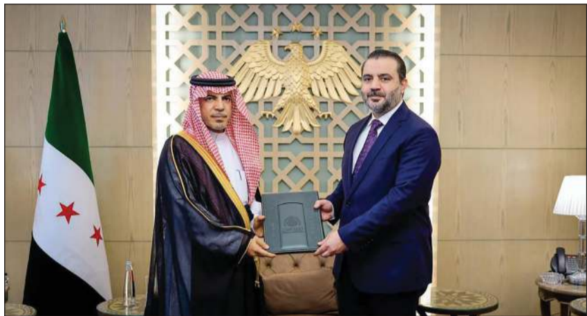
سفير خادم الحرمين الشريفين لدى سورية د. فيصل المجفل يسلم نسخة من أوراق اعتماده لوزير الخارجية أسعد الشيباني (سانا)

وكالات: قدم عدد من السفراء الجدد لدى سورية نسخاً من أوراق اعتمادهم إلى وزير الخارجية أسعد الشيباني وقال الحساب الرسمي لسفارة المملكة العربية السعودية في دمشق عبر منصة «اكس»: «قدم سفير خادم الحرمين الشريفين لدى سورية د. فيصل المجفل نسخة من أوراق اعتماده إلى وزير الخارجية والمغتربين أسعد الشيباني». وأكدت وكالة الأنباء السورية الرسمية (سانا) كذلك أن الوزير الشيباني استقبل كذلك سفير إيطاليا المعين لدى دمشق ستيفانو رافانان، وتسلم منه نسخة من أوراق اعتماده.