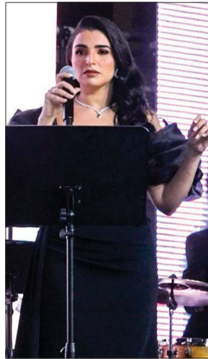
مهي فتوني في الحفل