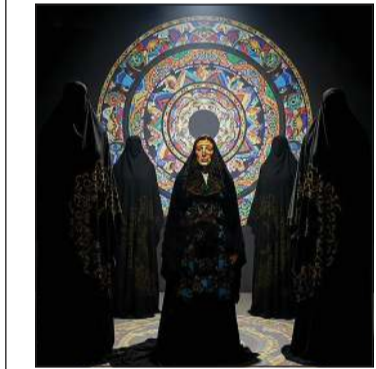
.. و«عباية» تقدم في الكويت الدولي للمونودراما»