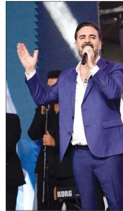
وائل جيسار وأغنية غربية الناس

يليلة طربية بكل ما تحملها الكلمة من معنى، عاشها الجمهور الكبير مساء أول أمس في قاعة «البركة» بفندق كراون بلازا، أحياها أثنان من أجمل الأصوات الطربية في عالمنا العربي وهما النجمان اللبنايان وائل جيسار ومهي فتوني، وتصدت لتقديمهما الإعلامية حليلة بولند بطريقتها «الحللمية»، التي تتميز بها، والتي تفاعل معها الحضور بشكل لافت.