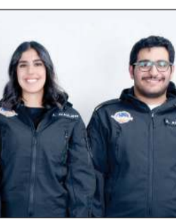
الفريق الفائز بهكاثون الكويت للفضاء

والمجالس الوعاني إن المشاركة في مؤتمر «الكويتية للاستثمار» في علوم الفضاء ومسؤولية باب التسجيل الهندسة إلى الغريمان. وأكد اللوغاني أن الفائزين في المؤتمر كانت مثمرة، حيث تخللها مقابلات عدة تضمنت لقاءات مباشرة مع وزير الشباب ثاني راشد قضاء إماراتي سلطان إماراتي مناز منصور، والذي استعرض تجربته في محطة الفضاء، فضلاً عن اجتماعات عدة عقدها مع وكالات خليجية من