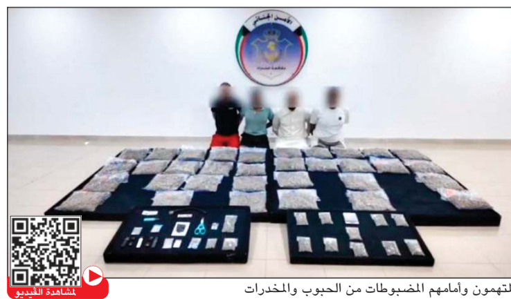
المتهمون وأمامهم المضبوطات من الحبوب والمخدرات

وأكدت الإدارة العامة لمكافحة المخدرات استمرارها في رصد ومتابعة كل الأنشطة المتعلقة بتجارة وتهريب المواد المخدرة والمؤثرات العقلية، واتخاذ الإجراءات القانونية بحق المتورطين، حماية للمجتمع من هذه الأفة الخطيرة.