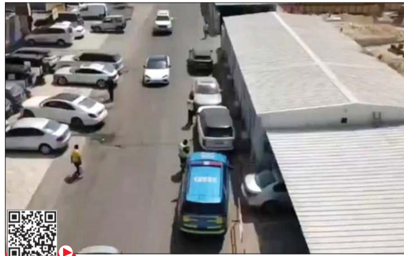
.. ومخالفات مباشرة حررت من قبل رجال مرور العاصمة