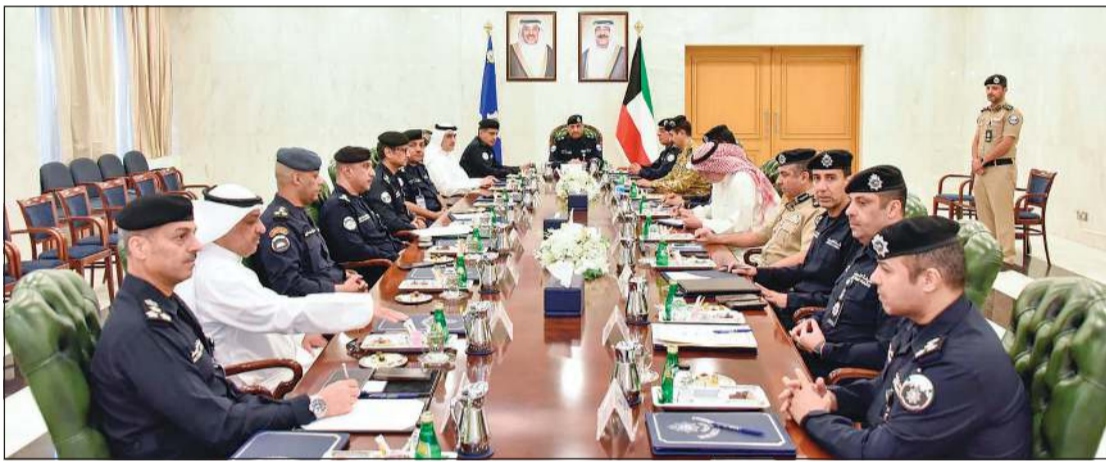
وكيل وزارة الداخلية بالتكليف اللواء علي العدواني مترشدا اجتماع رؤساء القطاعات الأمنية بحضور وكيل وزارة الداخلية المساعد لشؤون الأمن العام اللواء حامد الدواس

■ رفع مستوى الجاهزية الميدانية لضمان سرعة الاستجابة لأي طارئ وتعزيز التواجد الأمني في المواقع الحيوية والمرافق العامة ■ تطبيق القانون على الجميع بما يرسخ العدالة ويعزز هيبه القانون ■ تكثيف الجهود لضمان انسيابية الحركة المرورية وضبط المخالفات