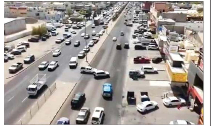
الطائرة الدرون إحدى وسائل ملاحقة مخالفي التخطي

خلال مجموعة من التعديلات والإجراءات التنظيمية التي توأمت أحدث التطورات التكنولوجية في مجال الخدمات المرورية، داعياً قائدي المركبات إلى ضرورة الالتزام بالتعليمات والإرشادات المرورية حفاظاً على سلامتهم أثناء القيادة والحد من الحوادث المرورية وما تخلفه من خسائر في الأرواح، مشيراً إلى أن الالتزام بالقانون وبالتعليمات المرورية يعكس مستوى الوعي والمسؤولية المجتمعية.