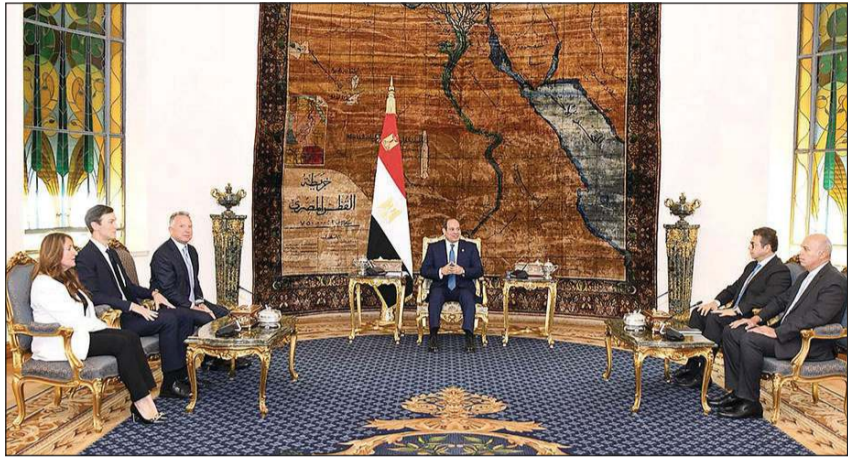
الرئيس عبدالفتاح السيسي مستقبلاً المبعوث الأميركي ستيف ويتكوف وجاريد كوشنر كبير مستشاري الرئيس الأميركي

على خطة الرئيس ترامب الذي سيتم التوقيع عليه، مؤكداً في السياق ذاته التزام مصر بالعمل بشكل وثيق مع الولايات المتحدة لاستكمال مشاركتها في مسار السلام في الشرق الأوسط الذي بادرت به مصر ورعته الولايات المتحدة منذ سبعينيات القرن الماضي، كما شدد الرئيس على ضرورة توقف إطلاق النار في القطاع بشكل فوري دون الحاجة للانتظار إلى حين التوقيع على الاتفاق ذي الصلة. وأشار المتحدث الرسمي إلى أن الرئيس أشاد بالدور الذي قام به الجانب الأميركي وكذلك الوسيط القطري والجانب التركي لدعم جهود الوساطة المصرية في مفاوضات شرم الشيخ، مؤكداً أن وقف الحرب والمنطقة هو أمر تتلاقى عليه إرادات جميع دول وشعوب المنطقة والعالم، مؤكداً أن مصر المتحدة والوسطاء والأطراف المعنية لتنفيذ ما تم الاتفاق عليه بإخلاص ومسؤولية، بما في ذلك وقف إطلاق النار، وإدخال المساعدات الإنسانية بكميات كافية، وإطلاق سراح الرهائن والأسرى. وذكر المتحدث الرسمي أن ويتكوف وكوشنر أكدا مجدداً عن تقدير الولايات المتحدة الأميركية للدور المحوري الذي قامت به مصر لإنهاء الحرب والاستعادة الاستقرار في المنطقة.