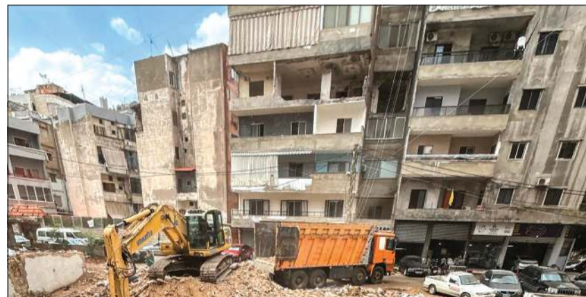
آلية خلال رفع الركام من الأبنية المهتمة في منطقة حارة حريك بالضاحية الجنوبية لبيروت

رحب رئيس الجمهورية العماد جوزف عون بالاتفاق الذي تم التوصل إليه بين إسرائيل وحركة «حماس» في مرحلته الأولى، والذي يهدف إلى إنهاء الحرب على قطاع غزة. وأعرب عن أمله في أن يشكّل هذا الاتفاق خطوة أولى نحو وقف دائم لإطلاق النار وإنهاء المعاناة الإنسانية للشعب الفلسطيني الشقيق في غزة، مؤكداً «ضرورة استمرار الجهود الدولية والإقليمية لتحقيق سلام شامل وعادل في المنطقة». وتمنى أن «تتجاوز إسرائيل مع الدعوات التي صدرت عن قادة الدول العربية والأجنبية من أجل وقف سياساتها العدوانية في فلسطين ولبنان وسورية، لتوفير المناخات الإيجابية للعمل من أجل سلام عادل وشامل ودائم يحقق الاستقرار في منطقة الشرق الأوسط».