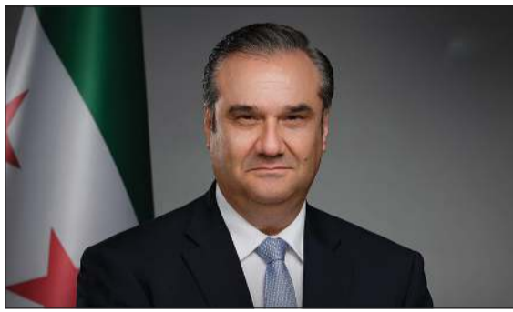
حاكم مصرف سورية المركزي عبد القادر الحمصيرة

وبين الحمصيرة أن المركزي سيعمل بالإشراف المباشر على تنفيذ نظام الترخيص المذكور، من خلال سجل وطني إلكتروني لتتبع الذهب، بما يضمن الشفافية والمساءلة في جميع مراحل التوريد والإنتاج والتصدير. وأكد الحمصيرة أن إعادة النظر في نظام استيراد وتصدير الذهب، ووضع نظام لترخيص المصافي خطوة مهمة نحو تنظيم سوق الذهب في سورية، وتعزيز موارد الدولة، وبما يخدم مسيرة التعافي الاقتصادي وبناء اقتصاد وطني قوي ومستدام. ويأتي هذا الإجراء في إطار جهود المصرف لتطوير نظام القطع والذهب ودعم قطاع المعادن الثمينة، وتطبيق سياسة نقدية سليمة، حيث أعلن الحاكم في إطار الجهود ذاتها، يوم الأحد الماضي أن المركزي بصدد إحداث مديرية متخصصة لحماية المستهلك في الخدمات المالية.