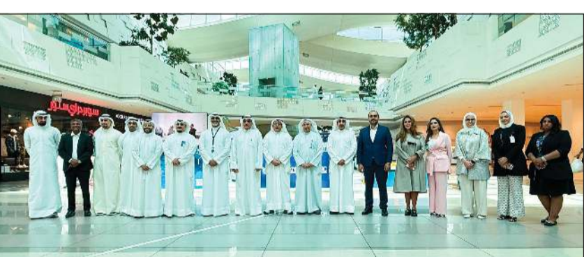
صورة جماعية للمشاركين خلال إطلاق البطولة

وخل المشكلات، ما يؤكد أن الاستثمار في الشباب هو أفضل طريق لبناء اقتصاد رقمي يلبق بطموحات الكويت، منطلعا إلى نجاحات أكبر بمواصلة دورنا في تمكين جيل رقمي قادر على الابتكار وبناء القدرات التكنولوجية الواعدة.