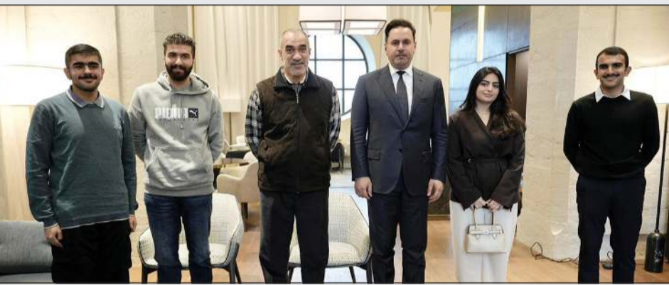
النائب الأول لرئيس مجلس الوزراء ووزير الداخلية الشيخ فهد اليوسف خلال لقائه عددا من الطلبة المبتعثين في ليون الفرنسية بحضور سفيرنا في فرنسا عبدالله الشاهين

اليوسف إلى الولايات المتحدة، وأكدت أهميتها في تعزيز علاقات البلدين وتوسيع آفاق التعاون المشترك. كما أشادت بالشراكة الاستراتيجية الراسخة بينهما في مختلف مجالات التعاون والعمل المشترك. وقالت الوزارة إن الشيخ فهد اليوسف أكد من جانبه اعتزاز الكويت بالعلاقات الاستراتيجية التي تربطها بالولايات المتحدة. وشدد على أهمية توسيع آفاق التعاون وبحد التنسيق المشترك في المجالات الاستخباراتية والأمنية ذات الاهتمام المشترك بما يدعم جهود البلدين الصديقين في ترسيخ الأمن والاستقرار الإقليمي والدولي. وأضافت أنه أعرب عن تطلع الكويت للاستفادة من الخبرات والبرامج التدريبية المتقدمة التي توفرها المؤسسات الأميركية