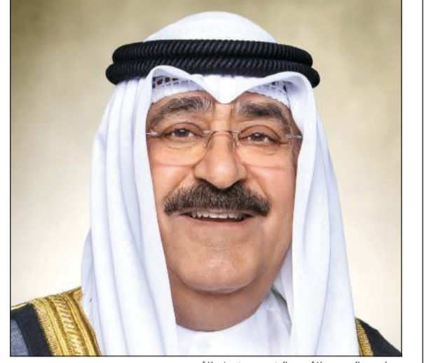
صاحب السمو الأمير الشيخ مشعل الأحمد

كونا: بعث صاحب السمو الأمير الشيخ مشعل الأحمد ببرقية تهنئة إلى الرئيس فلاديمير بوتين رئيس روسيا الاتحادية الصديقة، عبر فيها سموه عن خالص تهنائه بمناسبة ذكرى عيد ميلاده، متمنيا سموه له موفور الصحة والسعادة ولروسيا الاتحادية وشعبها الصديق كل التقدم والازدهار وللعلاقات المتميزة بين البلدين الصديقين المزيد من التطور والنماء. كما بعث صاحب السمو الأمير الشيخ مشعل الأحمد ببرقية تهنئة إلى أخيه الرئيس عبدالفتاح السيسي رئيس جمهورية مصر العربية الشقيقة، عبر فيها سموه عن خالص تهنائه بمناسبة فوز د.خالد أحمد العناني بمنصب مدير عام منظمة الأمم المتحدة للتربية والعلوم والثقافة (اليونسكو)، معربا سموه عن اعتزازه بهذا الفوز