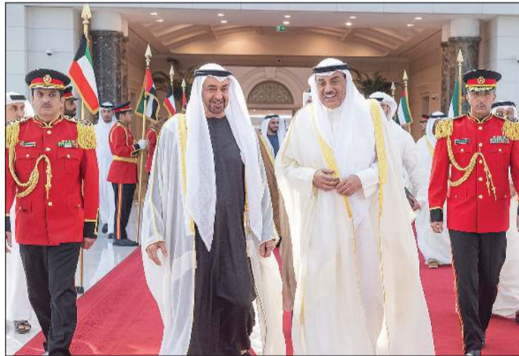
سمو ولي العهد الشيخ صباح الخالد مودعًا صاحب السمو الشيخ محمد بن زايد آل نهيان رئيس دولة الإمارات العربية المتحدة لدى مغادرته البلاد