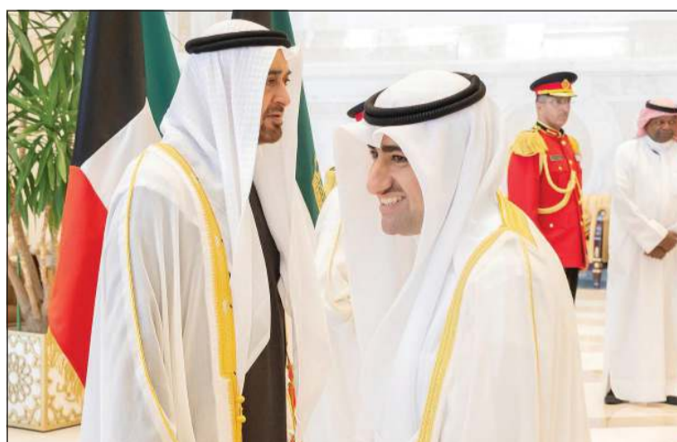
صاحب السمو الشيخ محمد بن زايد آل نهيان رئيس دولة الإمارات العربية المتحدة ووكيل الديوان الأميري الشيخ عبدالعزيز مشعل المبارك