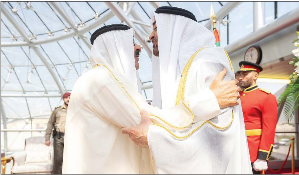
صاحب السمو الأمير الشيخ مشعل الأحمد مرحبًا بصاحب السمو الشيخ محمد بن زايد آل نهيان رئيس دولة الإمارات العربية المتحدة لدى وصوله إلى البلاد