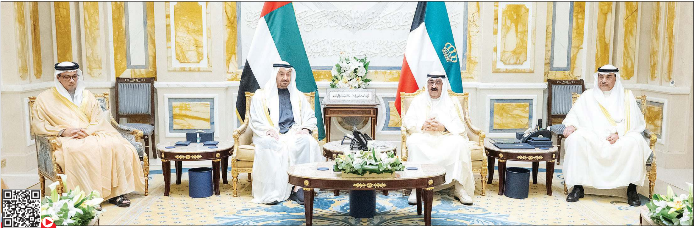
صاحب السمو الأمير مشعل الأحمد خلال المباحثات مع صاحب السمو الشيخ محمد بن زايد آل نهيان رئيس دولة الإمارات العربية المتحدة بحضور سمو ولي العهد الشيخ صباح الخالد وسمو الشيخ منصور بن زايد آل نهيان نائب رئيس الدولة نائب رئيس مجلس الوزراء رئيس ديوان الرئاسة

سمو الأمير ومحمد بن زايد تبادلًا الأحاديث الودية حول عمق العلاقات الأخوية التاريخية بين البلدين والشعبين وسبل تعزيزها وتنميتها بمختلف المجالات