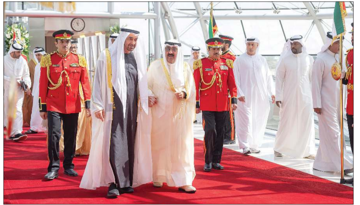
صاحب السمو الأمير الشيخ مشعل الأحمد مستقبلاً صاحب السمو الشيخ محمد بن زايد آل نهيان رئيس دولة الإمارات العربية المتحدة لدى وصوله إلى البلاد