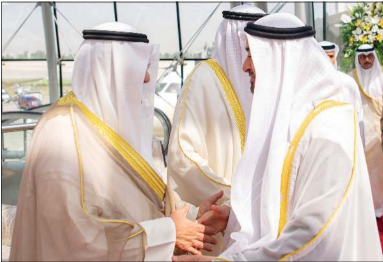
رئيس الوزراء سمو الشيخ أحمد عبدالله مرحبًا بصاحب السمو الشيخ محمد بن زايد آل نهيان رئيس دولة الإمارات العربية المتحدة