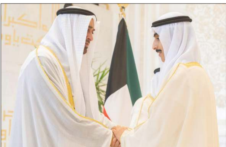
صاحب السمو الشيخ محمد بن زايد آل نهيان رئيس دولة الإمارات العربية المتحدة مصافحًا رئيس ديوان سمو ولي العهد الشيخ ثامر الجابر