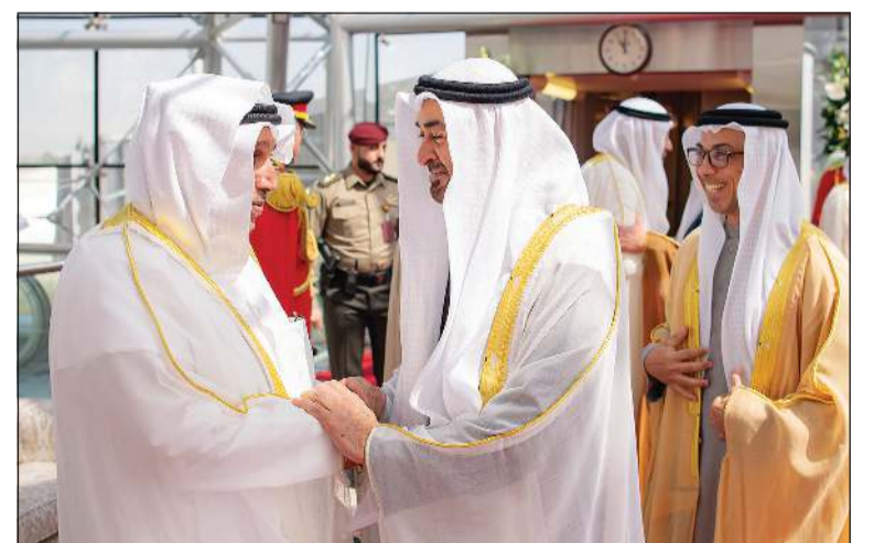
وزير شؤون الديوان الأميري الشيخ حمد جابر العلي خلال استقباله صاحب السمو الشيخ محمد بن زايد آل نهيان رئيس دولة الإمارات العربية المتحدة بحضور سمو الشيخ منصور بن زايد آل نهيان نائب رئيس الدولة نائب رئيس مجلس الوزراء رئيس ديوان الرئاسة

الدولة نائب رئيس مجلس الوزراء رئيس ديوان الرئاسة والفريق سمو الشيخ سيف بن زايد آل نهيان نائب رئيس مجلس الوزراء ووزير الداخلية وسمو الشيخ ذياب بن محمد بن زايد آل نهيان نائب رئيس ديوان الرئاسة للشؤون التنموية وأسر الشهداء وسمو الشيخ حمدان بن محمد بن زايد آل نهيان نائب رئيس ديوان الرئاسة للشؤون الخاصة وسمو الشيخ زايد بن محمد بن زايد آل نهيان والشيخ محمد بن حمد آل نهيان مستشار صاحب السمو رئيس الدولة وعدد من كبار المسؤولين في دولة الإمارات العربية المتحدة الشقيقة