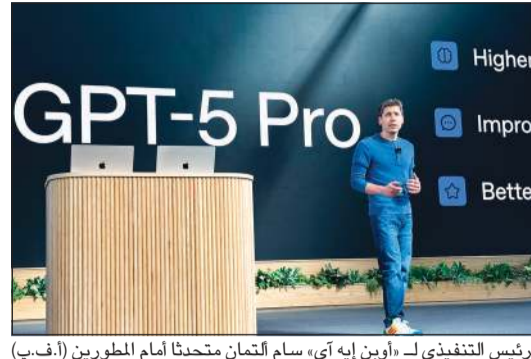
الرئيس التنفيذي لـ «أوبن إيه آي» سام ألتمان متحدثا أمام المطورين

عند اصطدامها بجدار، أظهرت تجارب أجريت في ثمانينيات القرن العشرين وكافت جائزة نوبل أصحابها الغالب، أن الجسيم، على المستوى الكمي، يمكنه المرور مباشرة عبر جدار مماثل، ومن هنا تسمية ظاهرة «النفق الكمومي». وبحسب لجنة نوبل، مهدت أبحاث العلماء «الطريق لتطوير الجيل المقبل من