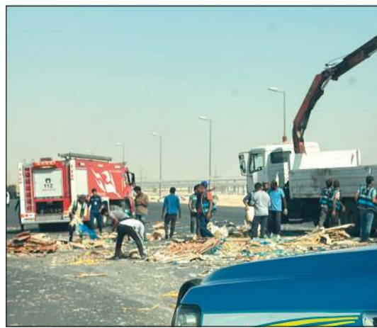
إزالة المادة الغذائية المبعثرة