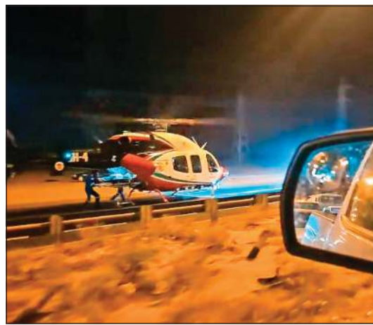
الإسعاف الطائر يقلع بالمصاب من طريق كبد

الحادث وقع بين سيارتين، مما أسفر عن إصابة مواطن، وتم نقله بطائرة إسعاف إلى المستشفى، حيث أدخل غرفة العمليات، فيما باشر رجال الدوريات تسهيل حركة المرور بعد سحب السيارتين من على الطريق. من جهة أخرى، أغلق رجال الأمن والمرور إحدى حارات المطلاع بعد انقلاب شاحنة محملة بالمواد الغذائية وإصابة قائدها. وكان بلاغ قد ورد إلى غرفة عمليات الداخلية