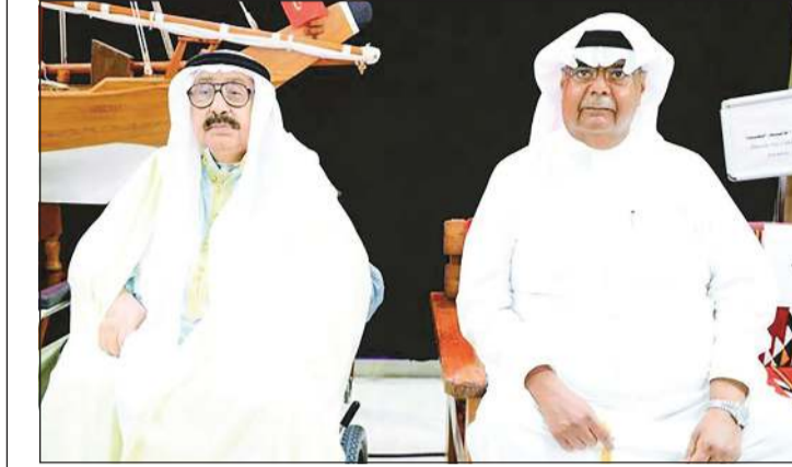
الفنان القدير شادي الخليج مع الملحن القدير أنور عبدالله

يحتفي مهرجان الموسيقى الدولي في دورته الـ 25 الذي ينظمه المجلس الوطني للثقافة والفنون والآداب خلال الفترة من 22 إلى 25 الجاري بالفنان القدير شادي الخليج، وذلك في حفل أفتتح المهرجان بمرکز الشيخ جابر الأحمد الثقافي باعتباره شخصية المهرجان من خلال أمسية غنائية بعنوان «صوت الكويت» بقيادة المايسترو د. خالد نوري وغناء عبدالعزيز المسباح وخالد العجيري، حيث سيقدم من خلال الأمسية مجموعة من أعماله الغنائية الخالدة التي قدمها في الفترة من ستينيات إلى تسعينيات القرن الماضي وتتخللها مقاطع مرئية إيضاحية للكشف عن زوايا عديدة من حياته الفنية المميزة. كما ستقام ضمن أنشطة المهرجان فعالية (ملتقى شخصية المهرجان) تضم حلقات نقاشية تقام في فندق فورويينس الأولى بعنوان «شخصية الفنان القدير شادي الخليج» يتحدث فيها د.يوسف الرشيد والملحن القدير