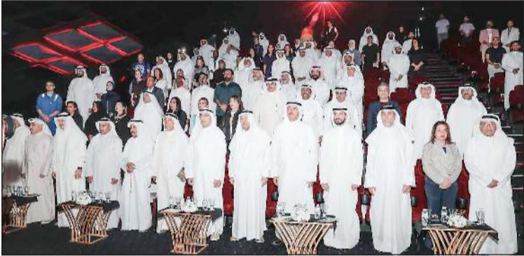
الحضور وقوفاً عند عزف السلام الوطني

الجديدة، حيث تسعى شركة نفط الكويت من خلال مثل هذه المبادرات إلى تعزيز التواصل بين القطاع النفطي والمجتمع، ودعم الفنون والثقافة باعتبارها ركائز أساسية للتنمية المستدامة ورؤية «كويت جديدة 2035». وفي ختام الحفل تم تقديم درع تكريمية للفنان القدير سعد الفرج، تعبيراً عن تقدير الشركة لعطائه ومسيرته الحافلة، وأعقب ذلك عرض الفيلم الوثائقي الذي نال إعجاب واستحسان جميع الحضور لما تضمنه من لمسات فنية وإنسانية مؤثرة، نفذها المخرج مجبل الفرج بأسلوب احترافي متميز.