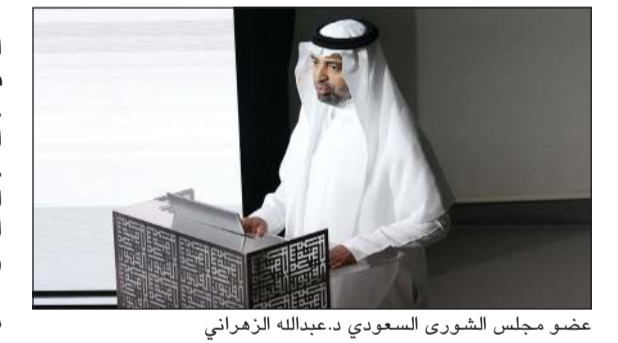
عضو مجلس الشورى السعودي د.عبدالله الزهراني

د.عبدالله الزهراني إن «التعدين» يمثل محورا أساسيا منذ فجر التاريخ إذ ارتبط اكتشاف الإنسان للمعادن بمرحلة مهمة في تطور الحضارات فيما يتجلى أثر التعدين بوضوح في التسلسل الحضاري بدءاً من العصر النحاسي مروراً بالبرونزي وصولاً إلى الحديدي مشيراً إلى دوره الحيوي في بناء أسس المجتمعات القديمة. وأوضح الزهراني أن اكتشاف المعادن في الجزيرة العربية يعود إلى زمن مبكر لاسيما الذهب والفضة والنحاس حيث بدأت صناعة التعدين في أطراف الجزيرة. وأشار إلى أن المعادن لعبت دوراً محورياً في بناء اقتصاد الممالك العربية القديمة ودول الفترة الإسلامية منذ نشأتها مؤكداً أنها ساهمت في تنظيم شؤون الدولة وتيسير حركة التجارة إذ أصبحت المناجم في الجزيرة العربية محط اهتمام الكثير من الخلفاء ووجهة اقتصادية مهمة لأرباب المهن والحرف من تجار المعادن إلى العمال.