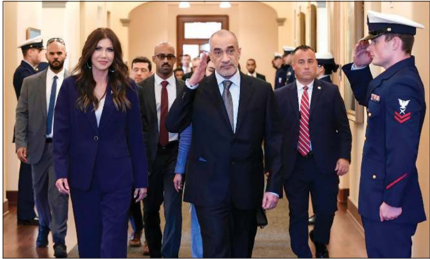
النائب الأول لرئيس مجلس الوزراء وزير الداخلية الشيخ فهد اليوسف خلال لقائه وزيرة الأمن الداخلي الأميركية كريستي نوبم