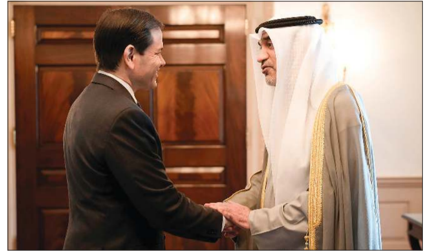
النائب الأول لرئيس مجلس الوزراء وزير الداخلية الشيخ فهد اليوسف خلال لقائه وزير الخارجية الأميركي ماركو روبيو