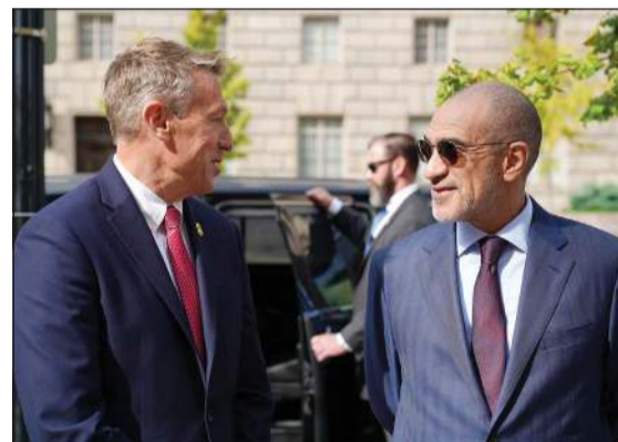
النائب الأول لرئيس مجلس الوزراء وزير الداخلية الشيخ فهد اليوسف مع مفوض هيئة الجمارك وحماية الحدود الأميركية روني سكوت

للتعزيز كفاءة إجراءات التفتيش والرقابة. وذكر البيان أنه في ختام اللقاء تم توقيع اتفاقية تهدف إلى تعزيز التعاون المشترك في مجالات أمن الحدود والجمارك وتبادل الخبرات الفنية بما يساهم في تطوير آليات العمل بين الجانبين ورفع كفاءة إجراءات التفتيش والمراقبة. وأكد الشيخ فهد اليوسف حرص الكويت على توسيع مجالات التعاون الجمركي والأمني مع الولايات المتحدة الأميركية، مشدداً على أهمية مواصلة تطوير آليات التنسيق لبناء قدرات وطنية مستدامة لتواكب المتغيرات المتسارعة في مجالات الأمن والمنافذ. ويأتي هذا اللقاء في إطار الزيارة الرسمية التي يجريها النائب الأول لرئيس مجلس الوزراء وزير الداخلية إلى الولايات المتحدة بهدف تعزيز التعاون الثنائي بين البلدين الصديقين. وكان النائب الأول لرئيس