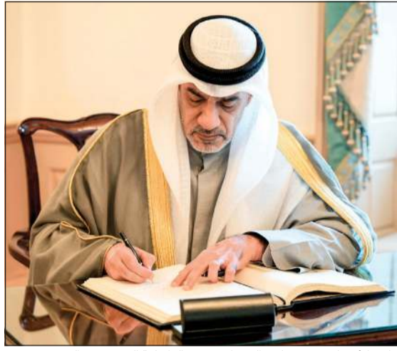
النائب الأول لرئيس مجلس الوزراء وزير الداخلية الشيخ فهد اليوسف يمد يده في تسجيل الزيارات بمقر الخارجية الأميركية