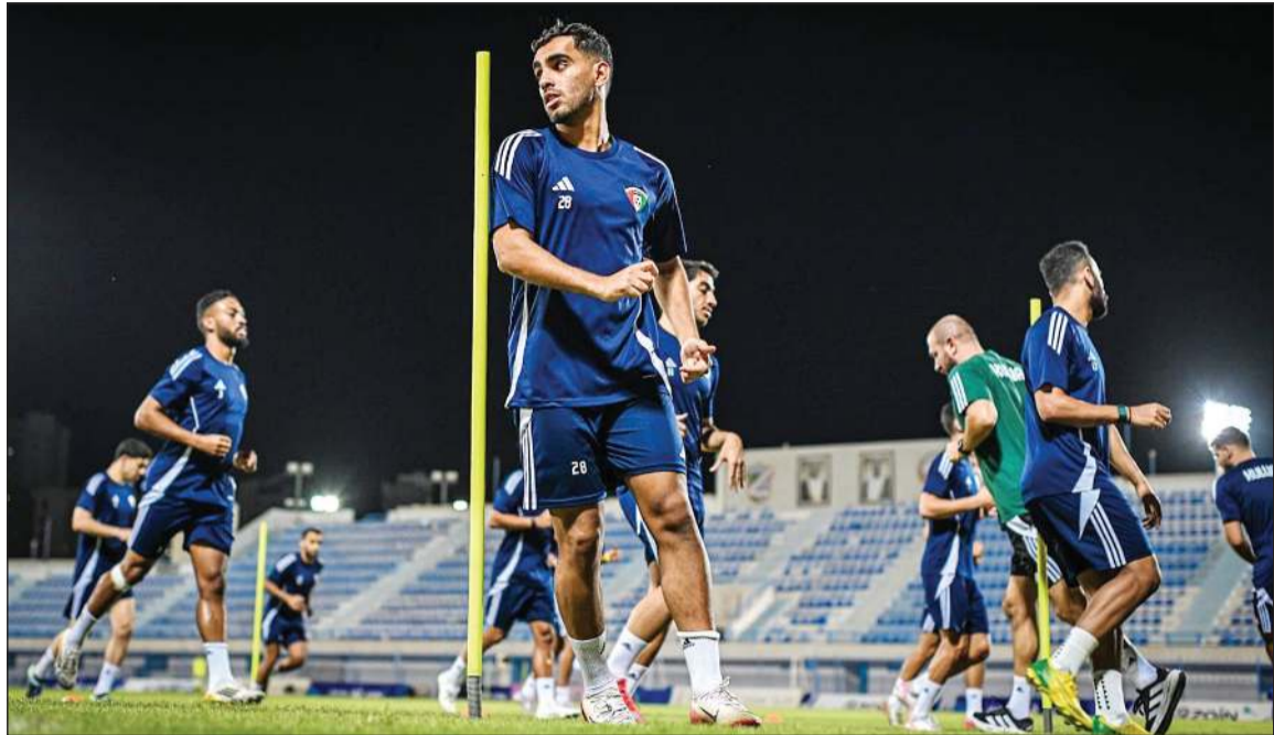
لاعبو منتخبنا الوطني خلال أحد التدريبات

إلى ذلك، أعلن الاتحاد الأوزبكي مساء أمس تعيين