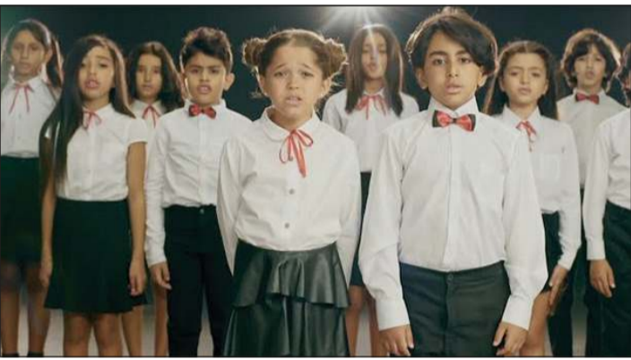
الأطفال المشاركون في الأوبريت الإنساني