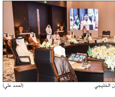
جانب من اجتماع وزراء الأوقاف بدول مجلس التعاون الخليجي

أكدت الكويت أن «أمتنا عامة، ودول مجلس التعاون على وجه الخصوص تعيش في هذه المرحلة الدقيقة التي تتسم بظروف استثنائية، ونحن نتابع بقلوب مليئة بالأسى والألم ما تعرضت له دولة قطر الشقيقة من اعتداءات غاشمة من قبل الكيان الصهيوني العاصي، بما يمثل انتهاكاً صارخاً لجميع المواثيق والأعراف الدولية».