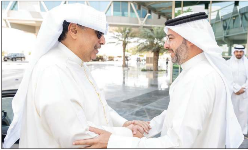
وزير شؤون الديوان الأميري الشيخ حمد جابر العلي خلال الزيارة وفي استقباله رئيس الهيئة العامة للطيران المدني الشيخ م.حمود المبارك

حمد جابر العلي: الهيئة واجهة البلاد وبوابة الدولة إلى العالم ومحرك مهم للاقتصاد والسياحة والاستثمار بما يحتم مواصلة رفع الكفاءة والارتقاء بجودة الخدمات