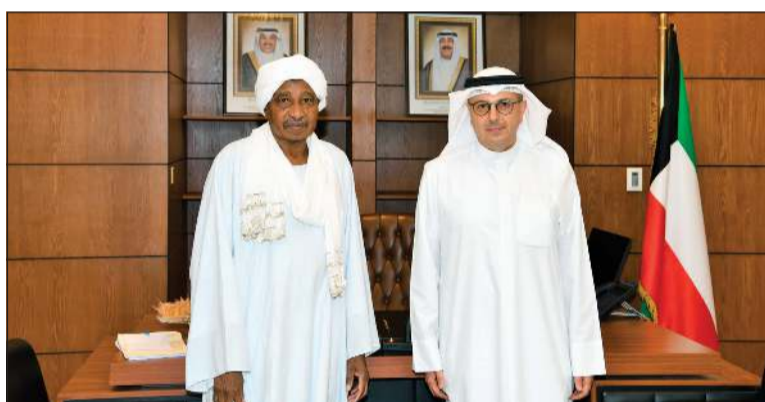
وزير الكهرباء والماء والطاقة المتجددة وزير المالية ووزير الدولة للشؤون الاقتصادية والاستثمار بالوكالة د.صبيح الخيزيم خلال لقائه المدير العام للمنظمة العربية للتنمية الزراعية البروفيسور إبراهيم الدخيري

الأميري بافتتاح المكتب الإقليمي للمنظمة لشبه الجزيرة العربية واليمن في الكويت بما يسهم في دعم الجهود التنموية الإقليمية. بدوره، أعرب الدخيري وفق البيان عن شكره وتقديره للكويت بقيادة وشعبها على الدعم والتسهيلات التي مكنت المنظمة من مباشرة أعمال مكتبها الإقليمي في الكويت، مؤكداً أن المكتب الجديد سيسهم في تحقيق مستهدفات التنمية الزراعية والتكامل العربي بما ينسجم مع أهداف التنمية المستدامة في المنطقة.