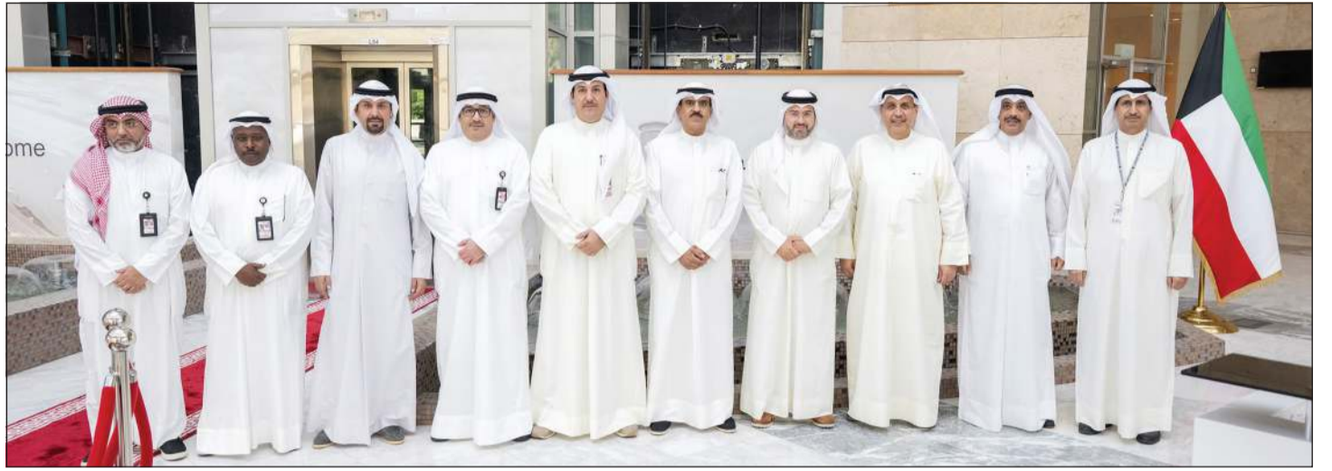
وزير شؤون الديوان الأميري الشيخ حمد جابر العلي ورئيس الهيئة العامة للطيران المدني الشيخ م.حمود المبارك ومنتسبو الهيئة

كونا: قام وزير شؤون الديوان الأميري الشيخ حمد جابر العلي بزيارة رئيس الهيئة العامة للطيران المدني الشيخ م.حمود المبارك، وذلك بمقر الهيئة، ونقل تحيات صاحب السمو الأمير الشيخ مشعل الأحمد لمنتسبي الهيئة، حيث أشاد سموه بجهودهم في الارتقاء بمنظومة الطيران المدني.