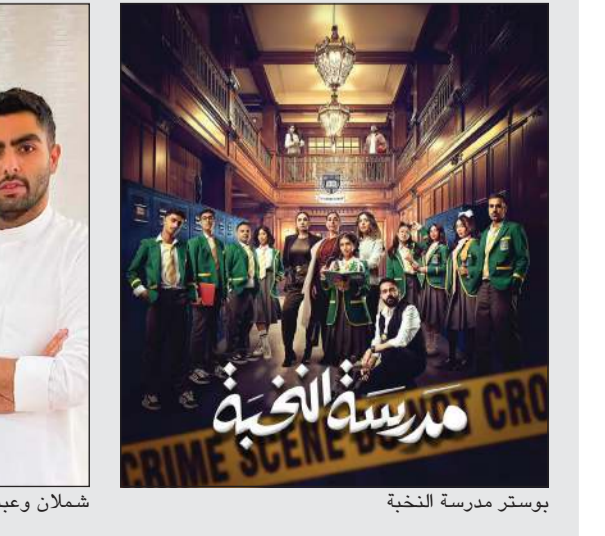
شملان وعبدالله مع الغالية وتعاون جديد بوستر مدرسة النخبة