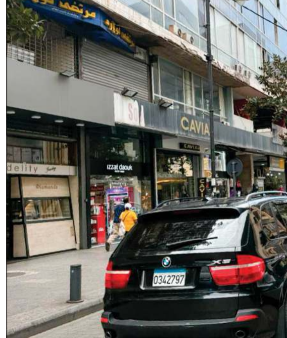
حركة نشطة في شارع الحمرا التجاري في بيروت

للأراضي اللبنانية المحتلة من قبل الجيش الإسرائيلي، علما انه سبق له تفقد هذه البقعة الجغرافية غير وهو يواظب على الإطلاع ميدانياً على الوضع على الأرض في تلك المنطقة الحساسة، والمقابلة فيها على الجيش مسؤولة الانتشار وجعلها منطقة خالية من السلاح غير الشرعي. وهذا الأمر تحقق في شكل واضح للعيان، من خلال منع الظهور المسلح، والانتشار المكثف للجيش. وما يحول دون إعلان المنطقة خالية من السلاح، هو الاحتلال الإسرائيلي، ومنع الجيش الإسرائيلي الإهالي من تفقد أراضهم وممتلكاتهم، علما ان بعضها يحتاج إلى خريطة مساحة من الدوائر العقارية، جراء التدمير الشامل من قبل الجيش الإسرائيلي. كذلك ستحضر تداعيات إضاءة صخرة الروشة في الجلسة، في ضوء إدراج بند بناء لطلب وزير الداخلية والبلديات العميد أحمد الحجار بسحب العلم والخبر من جمعية «رسالات» التابعة لـ «حزب الله»، والتي حصلت على موافقة لتنظيم فعاليات عند صخرة الروشة، وقد أعلن عدد من نواب «الحزب» رفضهم الأمر «من بوابة