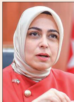
السفيرة التركية طوبى نور سونمز

السفيرة سونمز لـ «الأنباء»: تركيا تابعت التطورات منذ اللحظة الأولى واتخذت كل الإجراءات الدبلوماسية واللوجستية اللازمة لضمان العودة الآمنة لجميع المشاركين