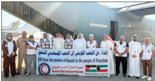
مبرة العوازم شاركت في الجسر الجوي الكويتي