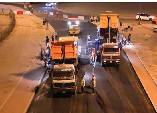
جانب من أعمال صيانة الطرق