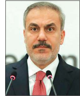
وزير الخارجية التركي هاكان فيدان

وكالات: قال وزير الخارجية التركي هاكان فيدان إن الرئيس رجب طيب أردوغان بحث مع الرئيس الأمريكي دونالد ترامب قضايا إقليمية ودولية، لافتا إلى أن الملف الفلسطيني كان في صدارة جدول الأعمال، إضافة إلى الملف السوري.