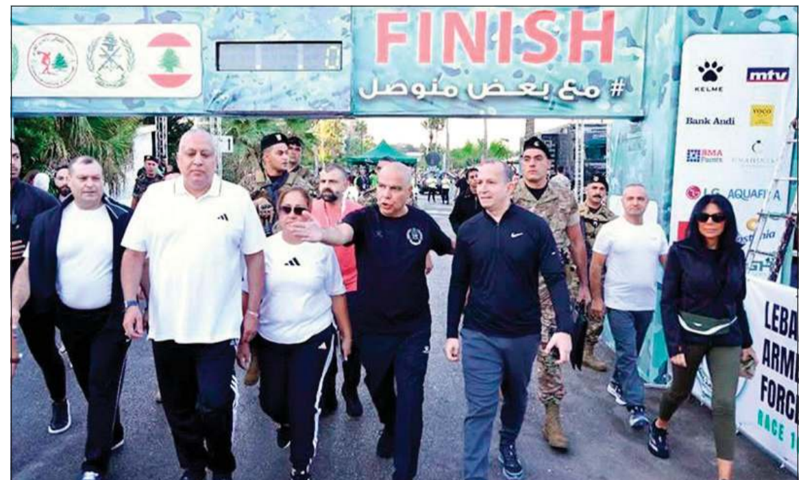
قائد الجيش العماد رويدف هيكل أثناء رعايته سباقا للجري تحت شعار «مع بعض متوصل» في بيروت

يمكن أن يبني على مضامينه داخليا وخارجا. في المقابل، هنا رئيس الجمهورية المديرية العامة لأمن الدولة، قيادة وضباطا وأفرادا، بالعهد الأربعين لإنشائها، ونوه «بالدور الذي تقوم به في إطار تنفيذ المهام الموكلة إليها استنادا إلى القوانين المرعية الإجراء». وقال رئيس الجمهورية: «في هذا التطور البارز الذي سجل في أداء أمن الدولة، يعود إلى حرص قيادتها على