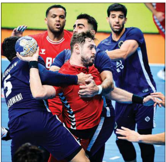
صراع قوي على الكرة بين لاعبي برقان والصليبخات

من جهة أخرى، واصل الكويت صدارته للترتيب العام للدوري التمهيدي لفئة البراعم بعد فوزه مساء الجمعة على الجهراء في اللقاء الذي دار بينهما على ملاعب مركز الشهيد فهد الأحمد بمقر اتحاد اليد في الدعية رافعاً رصيده إلى 10 نقاط، بينما بقي الجهراء على رصيده السابق بـ 5 نقاط، وشاركه خيطان الصدارة بنفس الرصيد من النقاط وذلك بعد فوزه على الفحيحيل.