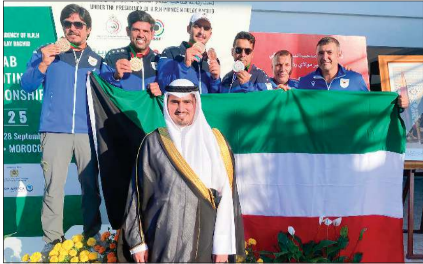
جانب من تتويج منتخبنا الوطني للرياضة