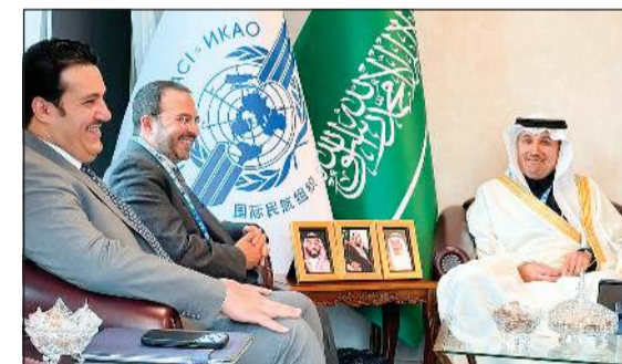
الشيخ م. حمود المبارك خلال اللقاء مع الوفد السعودي المشارك في اجتماعات منظمة «إيكاو»

ولفت إلى أن الاجتماع الثنائي مع الوفد القطري تناول تعزيز التنسيق في المواقف المشتركة بالمخالف الدولية والتعاون في مبادرات الطيران المستدام. وذكر البيان أن اللقاء مع الوفد العماني أكد أهمية توسيع التعاون بمجال النقل الجوي الإقليمي المتخصصة. وبين أن الاجتماع بين الوافدين الكويتي والإسباني تطرق إلى التعاون في مجالات التحول الرقمي والابتكار في قطاع الطيران، إضافة إلى تطوير حلول لحد من الانبعاثات فيما ناقش الاجتماع مع الوفد الماليزي سبل تبادل الخبرات في مجال إدارة المطارات وتعزيز التعاون في مجالات التكنولوجيا الحديثة وتطوير الكوادر البشرية.