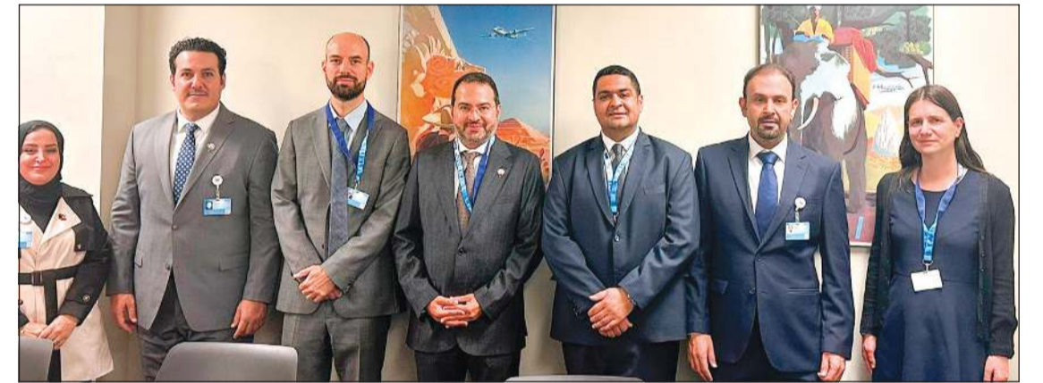
رئيس «الطيران المدني» الشيخ م. حمود المبارك مع الوفد الفرنسي

على هامش ترؤسه وفد الهيئة بأعمال الدورة الحالية للجمعية العامة لمنظمة «إيكاو»