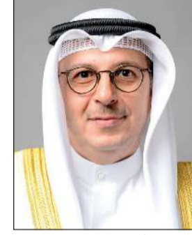
د. صبيح المخيزيم

أعلن وزير الكهرباء والماء والطاقة المتجددة ووزير المالية ووزير الدولة للشؤون الاقتصادية والاستثمار بالوكالة د. صبيح المخيزيم أن الوزارة حققت إنجازاً نوعياً غير مسبوق في مجال إدارة الطلب على الطاقة الكهربائية، حيث بلغ الحمل الأقصى للكهرباء 17,610 ميغاواط وفق الأحمال المسجلة على الشبكة الكهربائية خلال صيف 2025، مسجلاً انخفاضاً بمقدار 30 ميغاواط مقارنة بالحمل الأقصى المسجل لصيف 2024 الذي بلغ 17,640 ميغاواط، علماً أن نسبة الزيادة السنوية التي كانت متوقعة للحمل الكهربائي الأقصى لصيف 2025 هي 4% وفق الدراسات التخطيطية للشبكة الكهربائية.