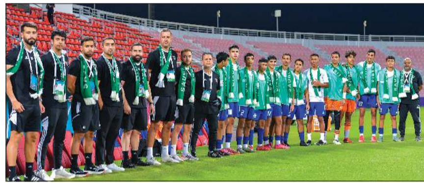
منتخبنا الوطني للناشئين يتمسك بأمل التأهل إلى نصف النهائي

يدخل منتخبنا الوطني للناشئين لكرة القدم تحت إماما مواجهة مصيرية عند الـ 17 عاما مواجهة البحرين عند الـ 8 مساء اليوم على ستاد سحيم بن حمد ببنادي قطر في ختام مباريات المجموعة الثانية من بطولة كأس الخليج لكرة القدم للناشئين التي تستضيفها العاصمة القطرية الدوحة حتى 3 أكتوبر المقبل، حيث يتمسك «الأزرق» بأمل التأهل إلى الدور نصف النهائي لمرافقة المنتخب السعودي الذي حجز البطاقة الأولى عن المجموعة. وفي مواجهة أخرى تشهد اهتمام «الأزرق»، يخوض المنتخب السعودي مباراة صعبة أمام