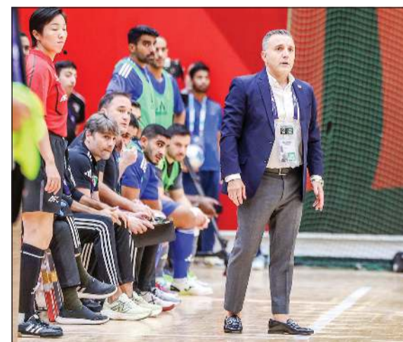
مدرب منتخبنا الوطني الإسباني برونو غارسيا فورموسو

القيام بعملية تغيير للتشكيلة، ويحتاج هؤلاء اللاعبون إلى الوقت للتطور. وبين برونو ان الوقت ليس طويلا لإعداد لنهايات كأس آسيا التي ستقام من 27 يناير حتى 7 فبراير 2026 في إندونيسيا، لكننا سنعمل بشكل مكثف لإعداد اللاعبين بصورة مثالية خاصة بعد خوض الكثير من المباريات الدولية الودية القوية والتي عادت بالفائدة على اللاعبين. سجل أهداف المنتخب الوطني في شباك استراليا كل من صالح الفضل وناصر العليان. وتأهل «الأزرق» إلى كأس آسيا بعد حلوله في المركز الثاني برصيد 7 نقاط وضمائه التواجد ضمن أفضل