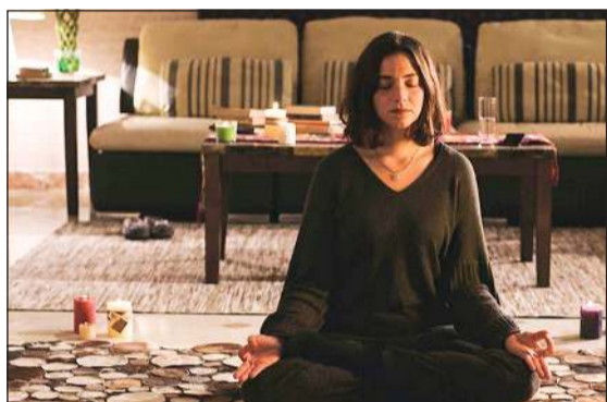
مشهد من «قصة الخريف»