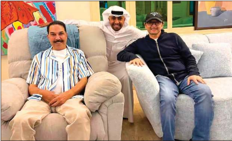
عبدالمجيد وعبدالله الرويشد وفهد الماص في منزل عبدالله الرويشد

استغل الفنان عبدالمجيد عبدالله وجوده في الكويت ليقوم بزيارة أخوية لصديقه ورفيق دربه الفنان عبدالله الرويشد في منزله بمنطقة الجابرية للاطمئنان على صحته بعد فترة انقطاع ليست بالطويلة، حيث جمعهم آخر لقاء عدة أشهر وتحديدا في حفل تكريم صناع الترفيه الذي يقام في المملكة العربية السعودية كل عام، حيث اجتمع عبدالمجيد والرويشد في النسخة الأخيرة للحفل قبل أن يلتقيان اليوم في منزل بو خالد.