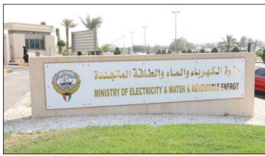
مدخل مبنى وزارة الكهرباء والماء والطاقة المتجددة