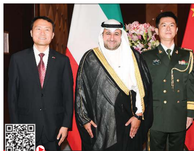
وكيل وزارة الدفاع الشيخ د.عبدالله المشعل مهنتاً

وتوقعت المصادر أن يتم تنفيذ الخط الهوائي خلال 3 سنوات بينما سيتم تحديد مدة تنفيذ مشروع المحطة بسنتين فقط، الأمر الذي يعني أنه سيتم إنشاء المحطة تزامناً مع الانتهاء من مشروع توريد وتركيب الخط الهوائي جهد 400 كيلو فولت. ولفتت إلى أن إنشاء هذه المحطة وتغذيتها من محطة الخيران عبر الخط الهوائي المذكور من شأنه أن يخدم مزارع منطقة العبدلية وأيضاً المنطقة الاقتصادية التي سيتم إنشاؤها مستقبلاً في منطقة العبدلية.