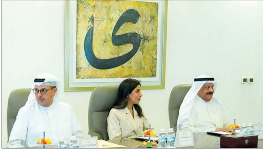
رئيس ديوان رئيس مجلس الوزراء عبدالعزيز الدخيل ووزيرة الأشغال العامة د.نورة المشعان ووزير الكهرباء والماء والطاقة المتجددة ووزير المالية ووزير الدولة للشؤون الاقتصادية والاستثمار بالوكالة د.صبيح المخيزيم