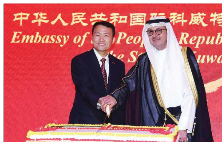
وزير الكهرباء والماء والطاقة المتجددة ووزير المالية ووزير الدولة للشؤون الاقتصادية والاستثمار بالوكالة د.صبيح المخيزيم والقائم بالأعمال الصيني خلال قطع كعكة الاحتفال

المركز الثقافي الصيني في الكويت الشهر المقبل. وختم القائم بالأعمال بالتحديد على أن الصين ستبقى شريكا موثوقا للكويت في مسيرتها التنموية، وستواصل العمل معها لفتح آفاق أرحب من التعاون، متمنياً للبلدين المزيد من الازدهار والرخاء.