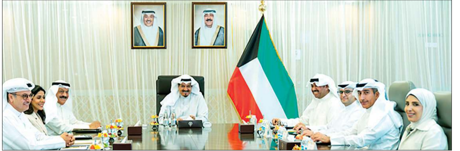
سمو الشيخ أحمد عبدالله رئيس مجلس الوزراء مترأساً الاجتماع الـ 28 للجنة التنفيذية للاتفاقيات ومذكرات التفاهم مع الصين بحضور رئيس ديوان رئيس مجلس الوزراء عبدالعزيز الدخيل ووزير الدفاع الشيخ عبدالله العلي ووزيرة الأشغال العامة د.نورة المشعان ووزير الدولة لشؤون البلدية ووزير الدولة لشؤون الإسكان عبداللطيف المشاري ووزير الكهرباء والماء والطاقة المتجددة ووزير المالية ووزير الدولة للشؤون الاقتصادية والاستثمار بالوكالة د.صبيح المخيزيم ورئيس إدارة الفتوى والتشريع المستشار صلاح الماجد وأنوار الداهش

للمرحلتين الثالثة والرابعة للطاقات المتجددة. وحضر الاجتماع رئيس ديوان رئيس مجلس الوزراء عبدالعزيز الدخيل ووزير الدفاع الشيخ عبدالله العلي ووزيرة الأشغال العامة د.نورة المشعان ووزير الدولة لشؤون البلدية ووزير الدولة لشؤون الإسكان عبداللطيف المشاري ووزير الكهرباء والماء والطاقة المتجددة ووزير المالية ووزير الدولة للشؤون الاقتصادية والاستثمار بالوكالة د.صبيح المخيزيم ورئيس إدارة الفتوى والتشريع المستشار صلاح الماجد.