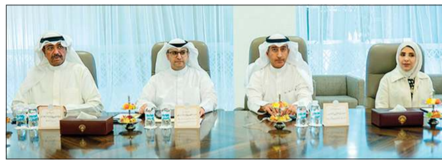
وزير الدفاع الشيخ عبدالله العلي ووزير البلدية ووزير الدولة لشؤون الإسكان عبداللطيف المشاري ورئيس إدارة الفتوى والتشريع المستشار صلاح الماجد وأنوار الداهش

البيئية ومكافحة التصحر. وقد وجه سمو رئيس مجلس الوزراء أعضاء لجنة المتابعة الوزارية كلا حسب اختصاصه بالتنسيق والتشاور والتعاون المشترك مع رؤساء مجالس الشركات الحكومية الصينية العملاقة المرشحة من قبل الحكومة الصينية وحثهم على البدء في توقيع الطرفين على عقود تنفيذ أعمال البناء والتشييد للمرحلة المقبلة في البلاد، مؤكداً أن إنجازات اقتصادية بارزة ستحقق بفضل الرؤى الاستراتيجية والخطط الموضوعة لعدد من المشاريع