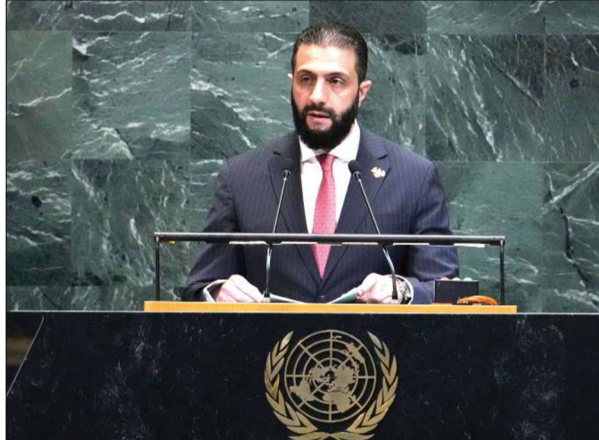
الرئيس السوري أحمد الشرع يلقي كلمة تاريخية أمام الجمعية العامة للأمم المتحدة

عواصم - وكالات: توج الرئيس السوري أحمد الشرع أسبوعه الدبلوماسي الحافل في نيويورك، وأصبح أول رئيس سوري يلقي خطاباً أمام الاجتماع رفيع المستوى للجمعية العامة للأمم المتحدة منذ 1967.