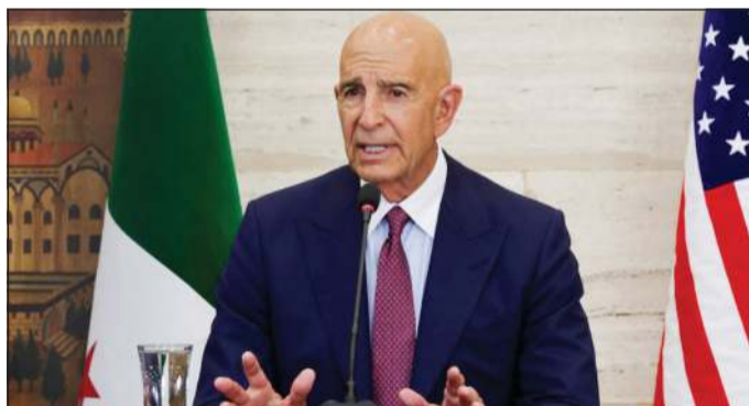
المبعوث الأميركي إلى سورية توماس باراك

دونالد ترامب، «سعى إلى التوصل إلى اتفاق بين الجانبين سيتم الإعلان عنه هذا الأسبوع، لكن لم يتم تحقيق تقدم كاف حتى الآن، كما أن عطلة رأس السنة العبرية هذا الأسبوع أبطأت العملية».