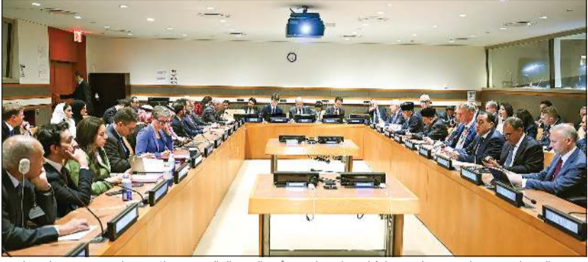
رئيس الوزراء مصطفى مدبولي يشارك في اجتماع بشأن دعم الاستقرار في غزة على هامش اجتماعات الجمعية العامة للأمم المتحدة

يأتي حضور رئيس مجلس الوزراء هذا الاجتماع، على هامش مشاركته على رأس وفد رفيع المستوى، نيابة عن الرئيس عبدالفتاح السيسي، في مؤتمر حل الدولتين، وافتتاح أعمال الشق رفيع المستوى للدورة الثمانين للجمعية العامة للأمم المتحدة، التي تعقد تحت شعار «معاً أفضل، 80 عاماً أكثر من أجل السلام والتنمية وحقوق الإنسان». وبدأ مصطفى مدبولي حديثه، خلال الاجتماع، بتوجيه الشكر للرئيس الفرنسي إيمانويل ماكرون على دعوته لهذا الاجتماع، وجهود من أجل دعم الحقوق الفلسطينية العربية السعودية عن عقد مؤتمر حل الدولتين، مؤكداً أن ذلك ما تعتبره مصر نقطة انطلاق على طريق التوصل إلى حل عادل ومستدام للقضية الفلسطينية على أساس من حل الدولتين وإنشاء الدولة الفلسطينية على خطوط الرابع من يونيو لعام 1967، وعاصمتها القدس الشرقية، كما تقدم رئيس الوزراء بالشكر للرئيس الفرنسي على القرار التاريخي باعتراض فرنسا بعودة فلسطين.