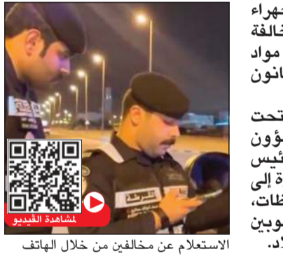
الاستعمال عن مخالفين من خلال الهاتف

أسفرت حملة لمديرية أمن محافظة الجهراء في منطقة سعد العبدالله عن تحرير 142 مخالفة مرورية متنوعة وضبط 3 أشخاص لحيازتهم مواد مخدرة ومسكرة و6 متغيبين ومخالفين لقانون الإقامة والعمل و3 مركبات مطلوبة قضائياً. وقالت وزارة الداخلية إن الحملة كانت تحت إشراف من وكيل وزارة الداخلية المساعد لشؤون الأمن العام اللواء حامد الدواس، وبحضور رئيس قطاع مديريات الأمن اللواء حمد المنيفي، مشيرة إلى استمرار الحملات الأمنية في مختلف المحافظات، بهدف فرض هيبة القانون، وضبط المطلوبين والمخالفين، وحفظ الأمن والاستقرار في البلاد.