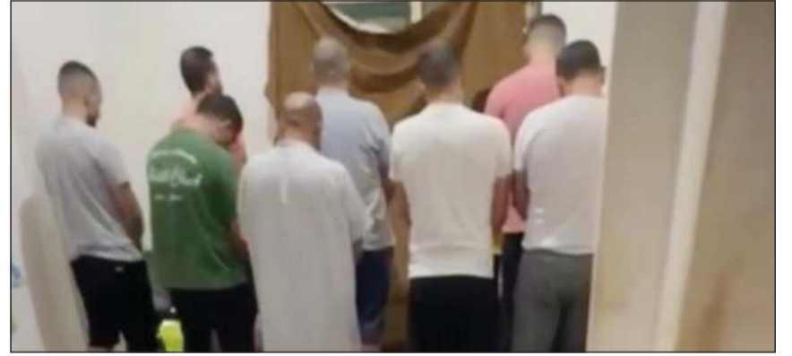
أعضاء الشبكة بعد القبض عليهم

الداخلية ان التحريات أكدت أن أحد أفراد الشبكة يستغل موقعه الوظيفي لتزوير معاملات تغيير السكن بمقابل مادي، وذلك بالتنسيق مع بقية الأطراف الذين يتولون تسليم المعاملات من المراجعين بمقابل مالي يصل إلى 120 ديناراً عن كل معاملة، تم تعقبها ببيانات غير صحيحة