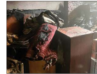
من حريق منزل الجابرية

سيطرت فرق إطفاء مركزي حولي والسالمية صباح أمس على حريق سرداب منزل في منطقة الجابرية، حيث باشرت الفرق بإخلاء المنزل بالكامل ومكافحة الحريق والسيطرة عليه، ولم يسفر الحادث عن أي إصابات تذكر.