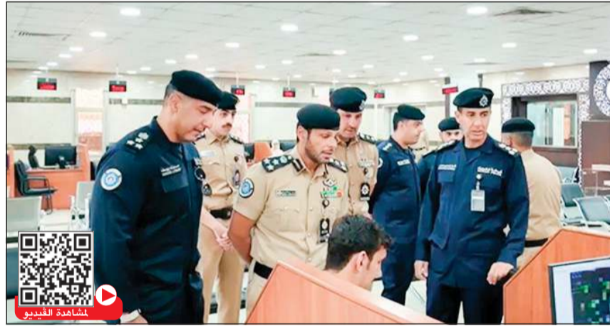
رئيس قطاع شؤون الإقامة والجنسية العميد فواز الرومي خلال تفقده مركز الهوية الوطنية بالشامية

العميد فواز الرومي اطلع خلال الجولة على آلية إنجاز المعاملات والإجراءات المتبعة في الإدارات والمراكز، والأنظمة التقنية الحديثة التي تسهم في سرعة إنجاز العمل. وقال الرومي إن هذه الجولات تأتي ضمن خطة عمل تهدف إلى الوقوف ميدانياً على مستوى الأداء، والتأكد من تذليل العقبات أمام الموظفين والمراجعين، مشيراً إلى أن مركز الشامية أصبح مركزاً شاملاً يقدم خدمات الجنسية والإقامة للمواطنين والمقيمين على حد سواء، وأن هناك خدمات خاصة لكبار السن وذوي الاحتياجات الخاصة، كما أوضح أن المواطن يستطيع إنجاز معاملته في أي محافظة دون قيود مكانية.