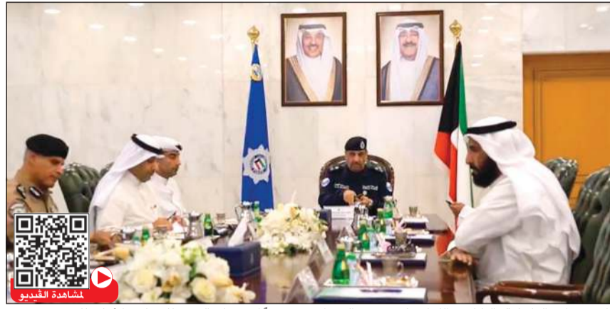
وكيل وزارة الداخلية بالتكليف اللواء علي مسفر العوداني مترشداً الاجتماع الـ 25 للمجلس الأعلى للمرور

مرتادي الطريق، ويعكس التزامها برسالتها في تعزيز الأمن المجتمعي بالكويت. ونقل اللواء العدواني إلى حضور الاجتماع تحيات وتقدير النائب الأول لرئيس مجلس الوزراء ووزير الداخلية الشيخ فهد اليوسف، وتمنياته للمجلس بالتوفيق في أداء مهامه وتحقيق أهدافه الرامية إلى تعزيز منظومة المرور وحماية مستخدمي الطريق. هذا، وحضر الاجتماع رئيس قطاع المرور والعمليات العميد عبدالله العتيقي، إلى جانب ممثلين عن بلدية الكويت، وجامعة الكويت، ووزارة التربية، ووزارة الإعلام، ووزارة الأشغال العامة.