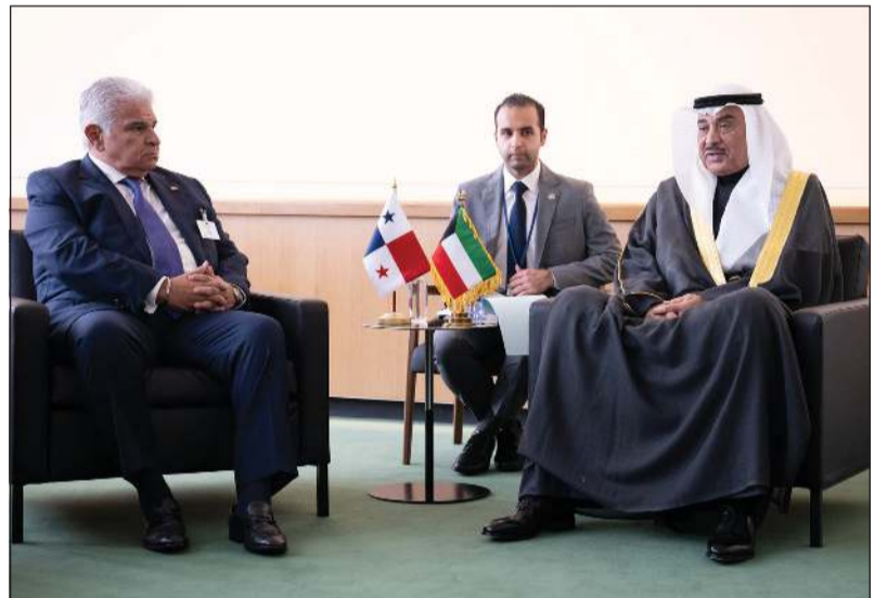
ممثل صاحب السمو الأمير الشيخ مشعل الأحمد سمو ولي العهد الشيخ صباح الخالد خلال اللقاء مع الرئيس خوسيه راؤول مولينو رئيس بنما