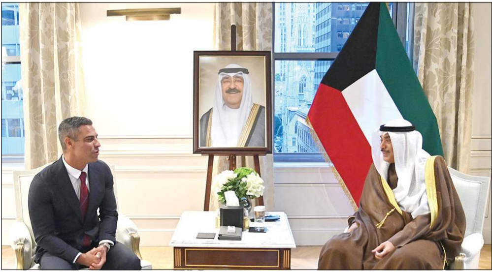
ممثل صاحب السمو الأمير الشيخ مشعل الأحمد سمو ولي العهد الشيخ صباح الخالد خلال اللقاء مع عمدة مدينة ميامي فرانسيس سواريز