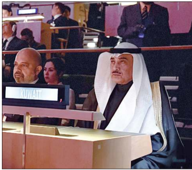
ممثل صاحب السمو الأمير الشيخ مشعل الأحمد سمو ولي العهد الشيخ صباح الخالد خلال مشاركته في الاجتماع رفيع المستوى بمناسبة ذكرى مرور 80 عاماً على تأسيس الأمم المتحدة

كونا: بعث سمو ولي العهد الشيخ صباح الخالد ببرقية تهنئة إلى أخيه خادم الحرمين الشريفين الملك سلمان بن عبدالعزيز آل سعود ملك المملكة العربية السعودية الشقيقة، عبر فيها سموه عن خالص تهانئه بمناسبة ذكرى اليوم الوطني للمملكة العربية السعودية الشقيقة، وعن إسهاماته بالإنجازات التنموية والحضارية التي حققها البلد الشقيق على جميع الأصعدة، مبتهلاً سموه إلى البراري جل وعلا أن يدبم على أخيه خادم الحرمين الشريفين وافر الصحة والعافية وأن يحقق للمملكة العربية السعودية الشقيقة كل الرقي والازدهار في ظل قيادته الحكيمة وبمؤازرة صاحب السمو الملكي الأمير محمد بن سلمان آل سعود ولي العهد رئيس مجلس الوزراء، من جانب آخر، بعث سمو ولي العهد الشيخ صباح الخالد ببرقية تهنئة إلى العقيد آسمي غويتا الرئيس الانتقالي لجمهورية مالي الصديقة ضمنها سموه خالص تهانئه بمناسبة ذكرى استقلال بلاده، متمنياً سموه له موفقور الصحة والعافية ولجمهورية مالي وشعبها الصديق كل التقدم والنماء.