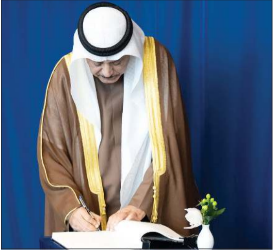
ممثل صاحب السمو الأمير الشيخ مشعل الأحمد سمو ولي العهد الشيخ صباح الخالد يسجل كلمة في سجل الأمم المتحدة