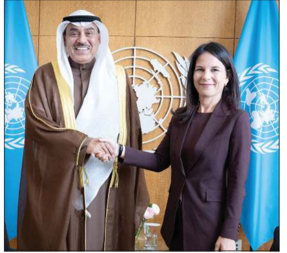
ممثل صاحب السمو الأمير الشيخ مشعل الأحمد سمو ولي العهد الشيخ صباح الخالد خلال اللقاء مع رئيسة الجمعية العامة للأمم المتحدة أنالينا بيربوك