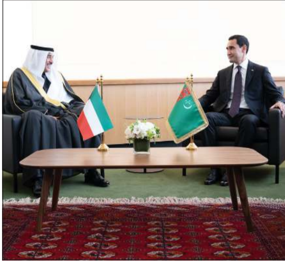
ممثل صاحب السمو الأمير الشيخ مشعل الأحمد سمو ولي العهد الشيخ صباح الخالد مستقبلا الرئيس سيردار بيردي محمدوف رئيس تركمانستان