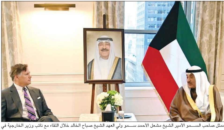
ممثل صاحب السمو الأمير الشيخ مشعل الأحمد سمو ولي العهد الشيخ صباح الخالد خلال اللقاء مع نائب وزير الخارجية في الولايات المتحدة الأمريكية الصديقة كريستوفر لاندو

هذا، وقد نقل سمو ولي العهد في مستهل اللقاء تحيات صاحب السمو الأمير الشيخ مشعل الأحمد إليه. وتم خلال اللقاء بحث العلاقات بين دولة الكويت وجمهورية تركمانستان الصديقة وسبل تطويرها بما يخدم مصالح البلدين والشعبين الصديقين. حضر اللقاء وكيل الشؤون الخارجية بالديوان الأميري مازن العيسى والمندوب الدائم للدولة الكويت لدى الأمم المتحدة السفير طارق محمد البناي. واستقبل ممثل صاحب السمو الأمير الشيخ مشعل الأحمد سمو ولي العهد الشيخ صباح الخالد وعمدة مدينة ميامي فرانسيس سواريز في مقر إقامة سموه بمدينة نيويورك في الولايات المتحدة الأمريكية. حضر اللقاء وكيل الشؤون الخارجية بالديوان الأميري مازن العيسى والمندوب الدائم للدولة الكويت لدى الأمم المتحدة السفير طارق محمد البناي. كما التقى ممثل صاحب السمو الأمير الشيخ مشعل الأحمد سمو ولي العهد الشيخ صباح الخالد رئيس سيردار بيردي محمدوف رئيس جمهورية تركمانستان الصديقة.