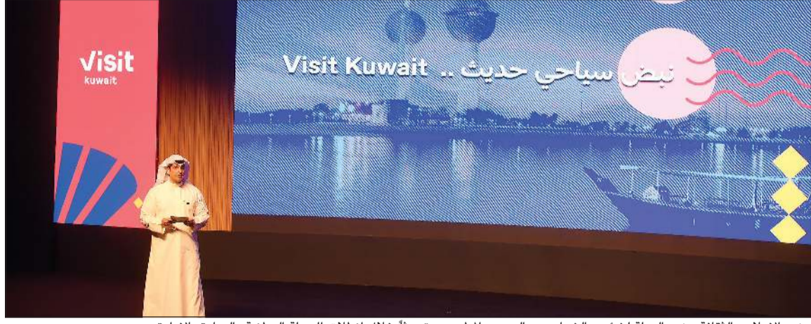
وزير الإعلام والثقافة وزير الدولة لشؤون الشباب عبدالرحمن المطيري متحدئا خلال انطلاق الحملة الوطنية «الريادة بالإرادة»