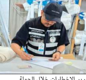
تحرير الإخطارات خلال الحملة

متعلقة باشتراطات السلامة المهنية، وذلك في إطار الجهود الرامية إلى تعزيز الالتزام بالقوانين والأنظمة المعمول بها، وضمان توفير بيئة عمل آمنة وفق الاشتراطات العمدة. وأكدت الجهات المشاركة استمرار تكثيف الحملات الرقابية في مختلف المناطق، واتخاذ الإجراءات القانونية بحق المخالفين، بما يحقق المصلحة العامة، ويحافظ على سلامة العاملين والمجتمع.