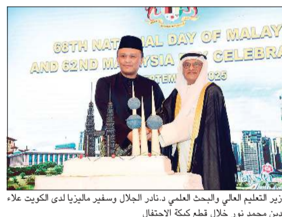
وزير التعليم العالي والبحث العلمي د.نادر الجلال وسفير ماليزيا لدى الكويت علاء الدين محمد نور خلال قطع كيكة الاحتفال

أكد سفير ماليزيا لدى الكويت علاء الدين محمد نور أن العلاقات بين البلدين، والتي تمتد لأكثر من ستة عقود، تشهد نقلة نوعية نحو شراكة إستراتيجية شاملة في ظل تقارب «رؤية الكويت 2035» والخطة الماليزية الثالثة عشرة 2026-2030». جاء ذلك خلال حفل استقبال أقامته السفارة الماليزية بمناسبة العيد الوطني الـ 68 ويوم ماليزيا الـ 62، بحضور وزير التعليم العالي والبحث العلمي د.نادر الجلال ووكيل وزارة الدفاع الشيخ عبدالله المشعل إلى جانب عدد من السفراء والديبلوماسيين. وأشار السفير إلى أن ماليزيا كانت أول دولة من جنوب شرق آسيا تفتتح سفارتها لها في الكويت عام 1974، تبعها الكويت بافتتاح سفارتها في كوالالمبور عام