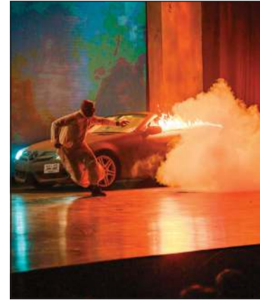
سيارة تحترق على المسرح