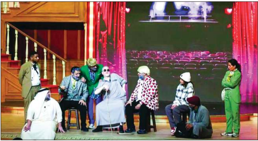
مشهد من المسرحية

يستعد الفنان خالد المظفر لتقديم أحدث أعماله المسرحية «ملك المسرح»، التي ستعرض خلال الأيام القليلة المقبلة على خشبة أوبرا دبي، في خطوة فنية بارزة تعكس الحضور الخليجي المتنامي على المسارح العربية الكبرى. المسرحية التي حققت نجاحاً لافتاً عند تقديمها في الكويت، تأتي اليوم بنسخة جديدة مخصصة للجمهور في الإمارات، حيث ستجمع بين الطابع الكوميدي والدرامي معاً، عبر نص معاصر يتناول قضايا اجتماعية وشبابية بلغة قريبة من الجمهور، وبأسلوب يجمع بين المتعة