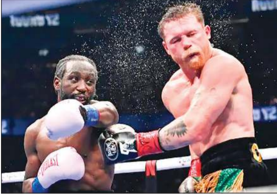
كروفورد يوجه لكمة خطافية قوية لكانييلو

الأميركي مارك ولبيرغ، إلى جانب الملاكمين التاريخيين توماس هيرنز وشاين موسلي، ولاعب كرة القدم الأمريكية السابق تشاد أوتشوسينكو، كما خُطف اليوتيوبر العالمي مستر بيست الأضواء بوجوده في لاس فيغاس، ليتحول الحدث إلى منصة تجمع بين نجوم الرياضة والفن وصناعة المحتوى، في تأكيد جديد على مكانة النزال كأحد أكبر الأحداث في العالم.