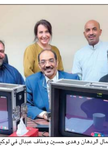
طارق العلي وجمال الردهان وهدى حسين ومناف عبدال في لوكيشن التصوير

استمر لعقود منذ تعاونهما في المسلسل التاريخي الشهير «مدينة الرياح» في ثمانينيات القرن الماضي، والذي لا يزال حاضراً في ذاكرة المشاهد الخليجي كأحد أبرز الإنتاجات الدرامية في تلك الحقبة. عودة هذا الثنائي بعد كل هذه السنوات تعد حدثاً فنياً ينتظره الجمهور بشغف. أما الفنان جمال الردهان، فقد اعتاد الجمهور رؤيته إلى جانب هدى حسين في أكثر من عمل درامي خلال السنوات الأخيرة، كان آخرها مسلسلات لاقت نجاحاً كبيراً عند عرضها في المواسم الرمضانية، ما جعل حضوره في «سبستر فخرية» امتداداً طبيعياً لتعاونه مع هدى حسين.