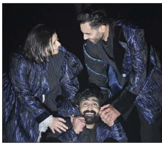
مسرحية «انتم مدعوون لحفلة» الفائزة في مهرجان الكويت المسرحي 24