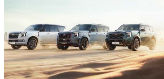
مجموعة طرازات باترول

والذين يجبرزان خيارين موقوقين يجمعان بين التقنيات الذكية والكفاءة العالية، ليواكبا احتياجات العائلات وعشاق المغامرات على حد سواء. وتجسد المجموعة المحدثة من سيارات الكروس أوفر والدفع الرباعي من نيسان التزام الشركة الراسخ بالابتكار والأداء المتميز ورضا العملاء في واحدة من أبرز أسواق العالم، حيث تتوافر حاليا في معارض نيسان الباطين وعبر شبكة شركاء نيسان في مختلف أنحاء الشرق الأوسط.