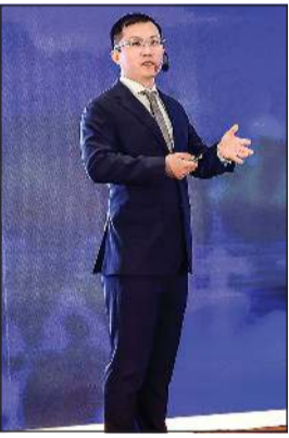
كاين نشر خلال الجلسة النقاشية الرئيسية