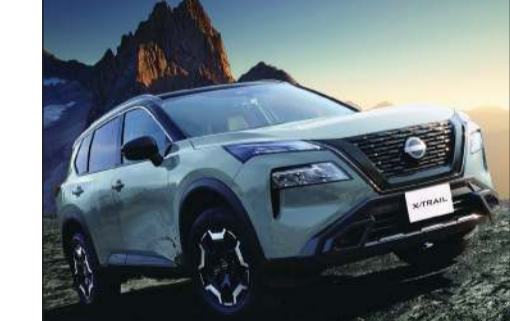
نيسان اكس تريول