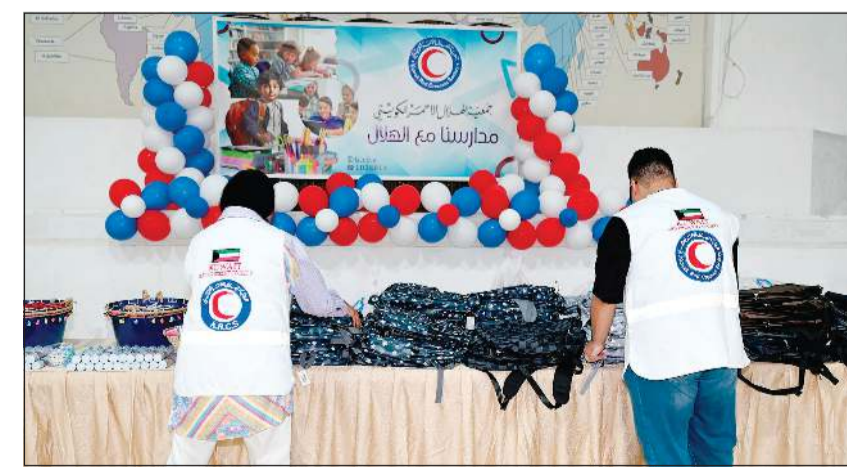
جانب من توزيع الحقائب المدرسية

شكرو للبنوك والشركات التي دعمت المشروع بتوفيرها الحقايب ومستلزماتها الدراسية، مشيراً إلى أن الشراكة بين القطاع الخاص والجمعيات الإنسانية تمثل نموذجاً مهماً للتكافل المجتمعي وتسهم في توسيع نطاق المستفيدين.