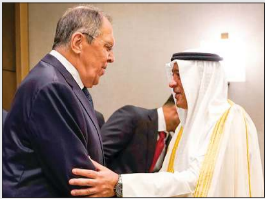
الأمير صباح الأحمد الصباح مع وزير الخارجية الروسي سيرغي لافروف

من أجهزة الأمم المتحدة، والتأكيد على أن البديل العادل والأنسب بعد إنهاء أعمال بعثة الأمم المتحدة لمساعدة العراق UNAM، ويجدد المجلس دعوة حكومة العراق للتعاون لإحراز تقدم في هذا الشأن وإلى بذل أقصى الجهود للوصول إلى حل نهائي لهذه الملفات.