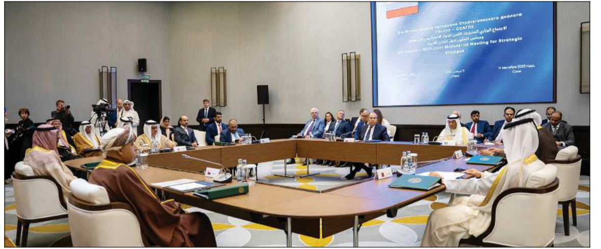
جانب من الاجتماع الوزاري المشترك الثامن للحوار الإستراتيجي بين مجلس التعاون وروسيا الاتحاديّة

أكد أن الحوار الإستراتيجي بين مجلس التعاون وروسيا منصة مهمة لتعزيز العلاقات