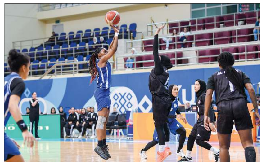
نادي القرين والفتاة في مشاركة سابقة