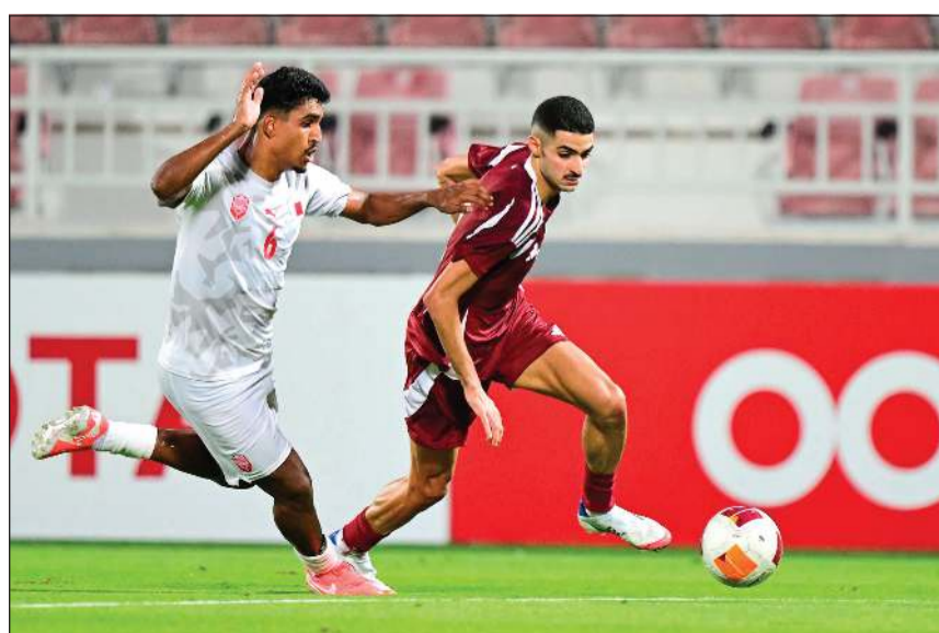
«العنابي الأولمبي» غير البحرين بصعوبة وتأهل إلى كأس آسيا

إيران «التاسعة»، كوريا الجنوبية «العاشرة»، وسورية «الحادية عشرة» إلى جانب السعودية مستضيف البطولة. من جانبه، ضمن «الأولمبي الإماراتي» التأهل من بين أفضل 4 منتخبات وصيفة بعد خسارته من المنتخب الإيراني الـ 2-3 وتوقف رصيده عند 6 نقاط وذلك بفضل فارق الأهداف (14+)، إلى جانب الصين (7 نقاط) من المجموعة الرابعة وأوزبكستان (7 نقاط) من المجموعة الخامسة ولبنان (7 نقاط) من المجموعة السادسة. وتستضيف السعودية النسخة السابعة من البطولة للمرة الأولى خلال الفترة من 7 إلى 25 يناير المقبل، على أن تجري مراسم القرعة الرسمية في 2 أكتوبر المقبل.