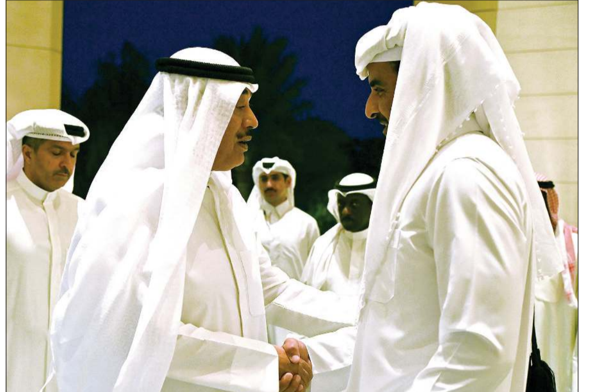
صاحب السمو الشيخ تميم بن حمد أمير قطر مستقبلاً ممثل صاحب السمو الأمير الشيخ مشعل الأحمد سمو ولي العهد الشيخ صباح الخالد

وصل إلى مطار الدوحة الدولي، وذلك في زيارة أخوية إلى دولة قطر الشقيقة. وكان في مقدمة استقبال سموه على أرض المطار سمو نائب الأمير الشيخ عبدالله بن حمد آل ثاني نائب أمير دولة قطر الشقيقة. وكان ممثلاً صاحب السمو الأمير الشيخ مشعل الأحمد، سمو ولي العهد الشيخ صباح الخالد، والوفد الرسمي المرافق لسموه غادر البلاد عصر امس متوجهاً إلى دولة قطر الشقيقة في زيارة أخوية. ويرافق سموه وفد رسمي يضم وزير شؤون الديوان الأميري الشيخ حمد جابر العلي، ورئيس ديوان سمو ولي العهد الشيخ ثامر الجابر.