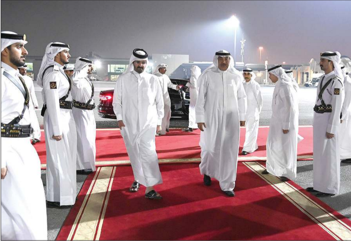
ممثل صاحب السمو الأمير الشيخ مشعل الأحمد سمو ولي العهد الشيخ صباح الخالد لدى مغادرته قطر وفي وداعه سمو نائب الأمير الشيخ عبدالله بن حمد آل ثاني نائب أمير قطر