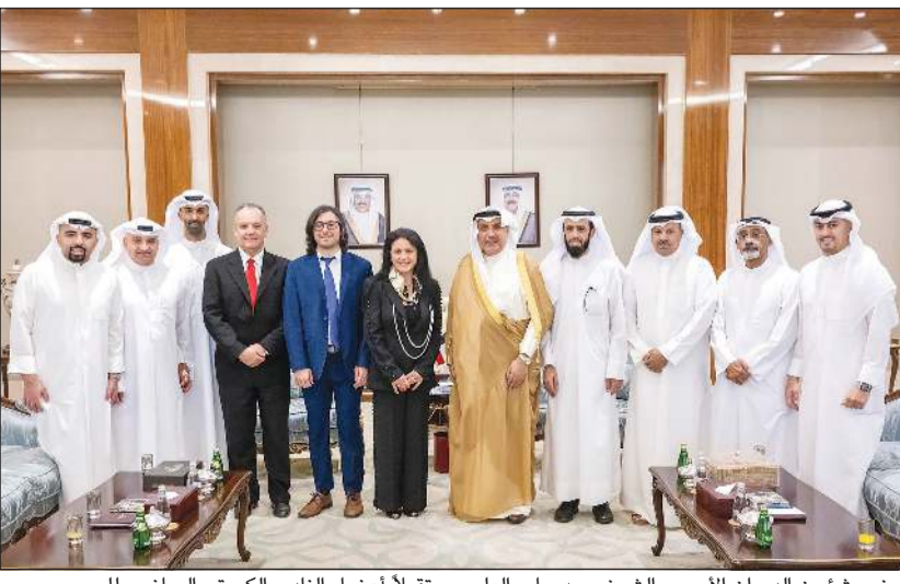
وزير شؤون الديوان الأميري الشيخ حمد جابر العلي مستقبلاً أعضاء النادي الكويتي الرياضي للصحف