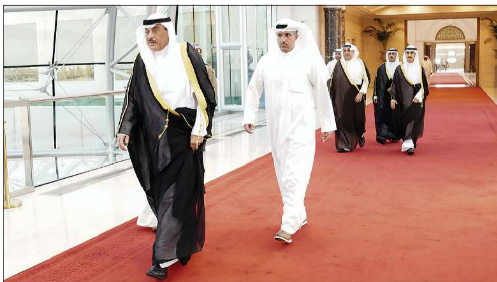
ممثل صاحب السمو الأمير الشيخ مشعل الأحمد سمو ولي العهد الشيخ صباح الخالد لدى مغادرته إلى قطر في زيارة أخوية ويبدو وزير شؤون الديوان الأميري الشيخ حمد جابر العلي ورئيس ديوان سمو ولي العهد الشيخ ثامر الجابر

والمقيمين على أراضيها. حضر اللقاء وزير شؤون الديوان الأميري الشيخ حمد جابر العلي ورئيس ديوان سمو ولي العهد الشيخ ثامر الجابر. هذا وغادر ممثل صاحب السمو الأمير الشيخ مشعل الأحمد، سمو ولي العهد الشيخ صباح الخالد، والوفد الرسمي المرافق لسموه مطار الدوحة الدولي وذلك بعد زيارته الأخوية لدولة قطر الشقيقة. وكان في وداع سموه على أرض المطار سمو نائب الأمير الشيخ عبدالله بن حمد آل ثاني نائب أمير دولة قطر الشقيقة. وكان ممثلاً صاحب السمو الأمير الشيخ مشعل الأحمد، سمو ولي العهد الشيخ صباح الخالد، والوفد الرسمي المرافق لسموه مطار الدوحة الدولي وذلك بعد زيارته الأخوية لدولة قطر الشقيقة. وكان في وداع سموه على أرض المطار سمو نائب الأمير الشيخ عبدالله بن حمد آل ثاني نائب أمير دولة قطر الشقيقة. وكان ممثلاً صاحب السمو الأمير الشيخ مشعل الأحمد، سمو ولي العهد الشيخ صباح الخالد، والوفد الرسمي المرافق لسموه مطار الدوحة الدولي وذلك بعد زيارته الأخوية لدولة قطر الشقيقة.