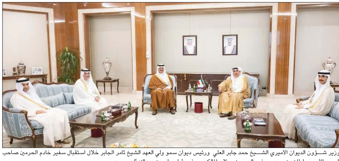
وزير شؤون الديوان الأميري الشيخ حمد جابر العلي ورئيس ديوان سمو ولي العهد الشيخ ثامر الجابر خلال استقبال سفير خادم الحرمين صاحب السمو الأمير سلطان بن سعد وسفير البحرين صلاح الملكي وسفير قطر علي بن عبدالله آل محمود

كونا: استقبل وزير شؤون الديوان الأميري الشيخ حمد جابر العلي، ورئيس ديوان سمو ولي العهد الشيخ ثامر الجابر بقصر بيان صاحب السمو الأمير سلطان بن سعد سفير خادم الحرمين الشريفين، وسفير مملكة البحرين صلاح علي الملكي، وسفير دولة قطر علي بن عبدالله آل محمود لدى الكويت لتقديم التهنئة بمناسبة تعيينهم في مناصبهم الجديدة. كما استقبل وزير شؤون الديوان الأميري الشيخ حمد جابر العلي في مكتبه بقصر بيان عدداً من أعضاء النادي الكويتي الرياضي للصحف.