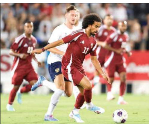
أكرم غفيف سجل الهدف الوحيد لقطر في ودية روسيا