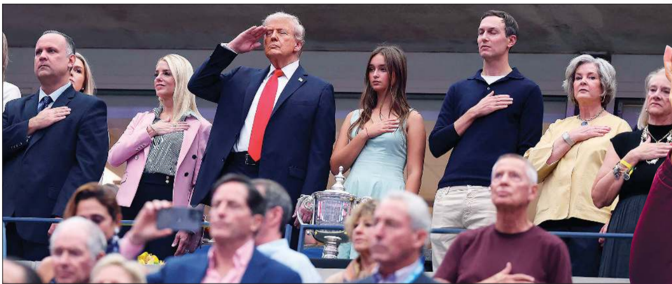
الرئيس الأميركي دونالد ترامب خلال السلام الوطني

لبطولة الولايات المتحدة المفتوحة. وحقق ألكاراز اللقب الكبير الثاني هذا الموسم بعد رولان غاروس عندما تغلب على سينر بالذات، والسادس في سبع نهائيات غراند سلام بعد فلاشينغ ميدوز عام 2022 على حساب النرويجي كاسير رود وويلدون 2023 على حساب الصربي نوكا ديوكوفيتش ورولان غاروس 2024 على حساب الألماني الكسندر زفيريف وويلدون 2024 على حساب ديوكوفيتش ورولان غاروس 2025. ولم يسبق للاعبين أن التقيا ثلاث مرات في نهائي بطولات غراند سلام خلال الموسم نفسه منذ بداية عصر الاحتراف عام 1968. كما كرس الإسباني تفوقه على صديقه الإيطالي بفوزه العاشر في 15 مواجهة، بينها 4 مرات في خمس مواجهات جمعتهما هذا العام. وتنافس ألكاراز وسينر للعام الثاني على التوالي القاب البطولات الأربع الكبرى في الموسم، حيث فاز كل منهما بلقبين.