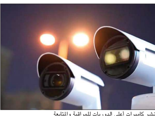
نشر كاميرات أعلى الدوريات للمراقبة والمتابعة

وذكرت وزارة الداخلية ان حصار الحملة الأمنية جاء على النحو التالي: تحرير 1078 مخالفة مرورية متنوعة، وضبط 5 مطلوبين، و7 مخالفين لقانون الإقامة والعمل، ومركبة مطلوبة قضائياً، وشخص بحالة غير طبيعية، وآخر لحيازته مواد يشتبه بأنها مسكرة، وإحالة 3 مركبات مخالفة لشروط الأمن والمخاتة إلى كراج حجز المركبات. وأكدت «الداخلية» استمرارها في