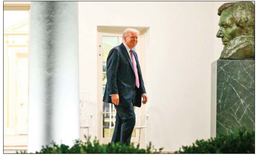
الرئيس الأميركي دونالد ترامب يمر بالقرب من تمثال نصفي لإبراهيم لينكولن خلال عشاء بمناسبة تجديد حديقة الورد في البيت الأبيض

للملياردير الجمهوري، ولم يعلن البيت الأبيض بعد تكلفة عملية تغيير اسم الوزارة، لكن صحيفة «بوليتيكو»، أفادت في تقرير أمس، بأن تكلفة تغيير المسمى قد تصل للمليارات الدولارات، مشيرة إلى أن إدارة الرئيس ترامب تسعى لتجنب التصويت في الكونغرس على التسمية الجديدة.