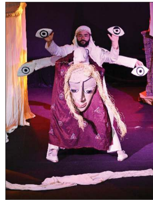
الساحرة «أم عيون» في المسرحية