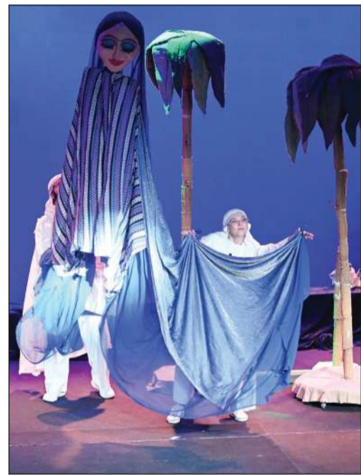
شخصية «أم المناديل» ومساعدتها للضياء على «أم عيون»