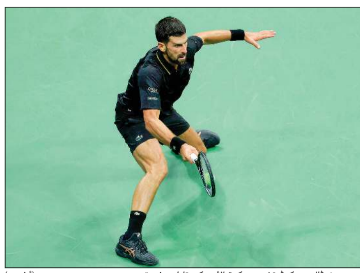
الصربي نوفاك ديوكوفيتش يرد كرة الأميركي تايلور فريتس (أ.ف.ب.)

أول لاعبة تحتفظ بلقب فلاشينغ ميدوز منذ الأميركي سيرينا وليامز في 2014.