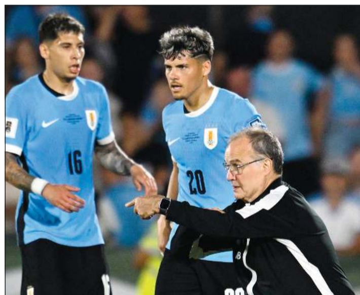
مدرب أوروغواي مارسيلو بيبلسا يوجه لاعبيه في مناسبة سابقة

الفوز أو ربما التعادل إذا صبت النتائج الأخرى في صالحها عندما تستضيف بوليفيا التي لم تفز عليها في عقر دارها منذ 31 عاماً.