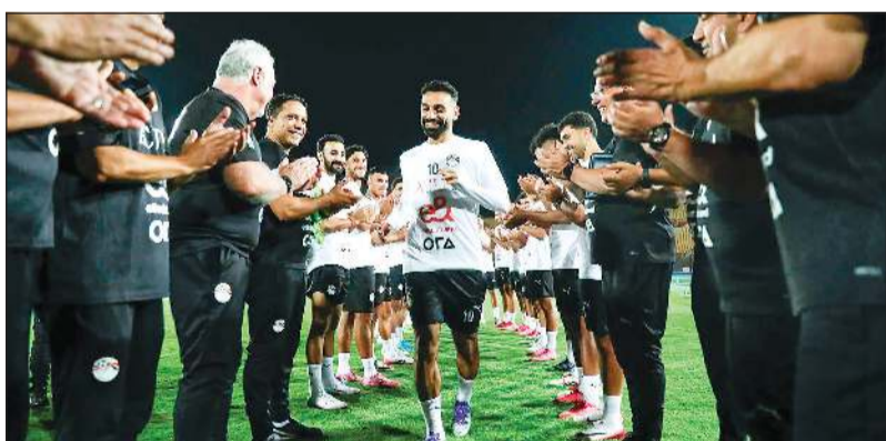
ممر شرفي لمحمد صلاح في معسكر «الفراعة»

برصيد 16 نقطة ثم بوركينا فاسو في السادسة بـ 11 نقطة، علماً أن المنتخبين سيلتقيان أيضاً في 9 الجاري، وتأتي سيراليون في المركز الثالث بـ 8 نقاط، ثم إثيوبيا رابعة برصيد 6 نقاط بالتساوي مع غينيا بيساو الخامسة بنفس الرصيد فيما يتتيل منتخب جيبوتي الترتيب بنقطة واحدة.