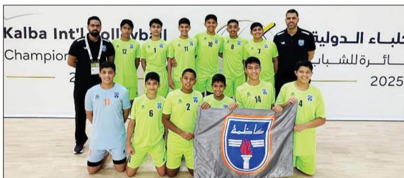
فريق الكرة الطائرة لأشبال بنادي كاظمة