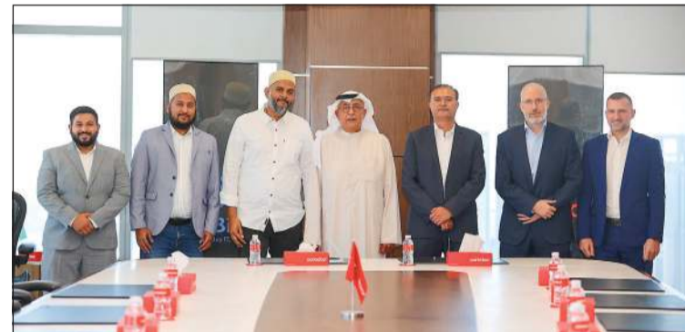
تابان تريبثاي ويغوب المنيع مع إداريي Ooredoo الكويت و «WiBi».

أعلنت شركة Ooredoo الكويت عن توقيع شراكة استراتيجية جديدة مع منصة WiBi (Want it Buy it)، المتخصصة في تجارة الإلكترونيات عبر الإنترنت، في خطوة ترمي في تعزيز تجربة تسوق أكثر ثراءً وابتكاراً لعملاء الشركة، وترسيخ مكانتها كشركة رائدة في تقديم أسلوب حياة رقمي متكامل.