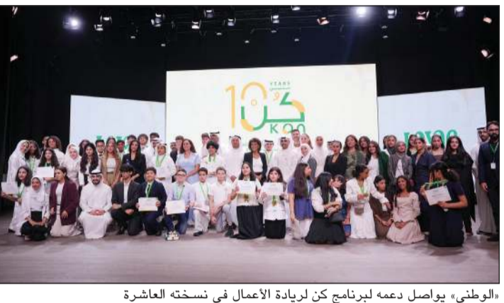
الوطني» يواصل دعمه لبرنامج كين لريادة الأعمال في نسخته العاشرة

وتضمن البرنامج جدولاً غنياً بالأنشطة التعليمية والتدريبية، كما شمل جلسات تدريبية متخصصة ونقاشات تفاعلية ومحاضرات عبر الإنترنت وورش عمل افتراضية، جميعها مصممة لتعزيز وتطوير برامج اجتماعية رائدة في الكويت.