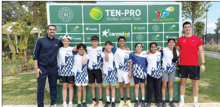
فريق الناشئين باكاديمية «أفا نادال» خلال مشاركته في بطولة تن برو للتنس في أنطاليا التركية