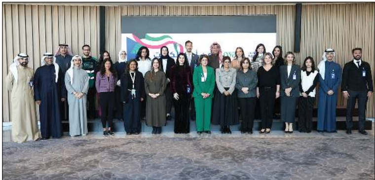
شراكة إستراتيجية مع «لويك» لدعم الاستدامة من أجل مستقبل أفضل للكويت