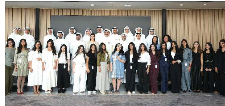
لقطة جماعية في ختام برنامج «أسباير»