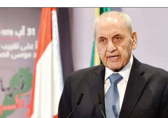
رئيس مجلس النواب نبيه بري يلقي كلمة في ذكرى تغيب الإمام السيد موسى الصدر

ومعلوم أن الأهالي والمقيمين في النبطية، يصفون في مجالسهم تلال جبل علي الطاهر بـ«المخازن المحصنة للحزب»، ويقولون إن المرتفعات صخرية ومن الصعوبة الوصول إلى ما هو تحتها. في الجنوب أيضاً، أفادت «الوكالة الوطنية للإعلام» الرسمية اللبنانية بأن مخابرات الجيش أوقفت في الساعات الماضية ثلاثة شبان من بلدة مجدل زون قضاء صور، كانوا أقدموا على منع دورية تابعة لقوات الطوارئ الدولية «اليونيفيل» من عبور البلدة، في وقت سابق. وكان المصدر الرسمي لـ«الأنباء»: «الحكومة اللبنانية ملتزمة بسياسة سلطة الدولة على كامل أراضيها، وهذا خيار لا يمكن التراجع عنه، وغير قابل للتفاوض أو المساومة، وهو نتيجة قناعات داخلية وليس نتيجة ضغوط دولية». وأضاف المصدر: «مواعيد سحب السلاح تحت سقف نهاية السنة الحالية التي فجرت الخلاف، جاءت في إطار التفاوض الدولي والورقة الأميركية، والتي تبناها لبنان في اجتماعات مجلس