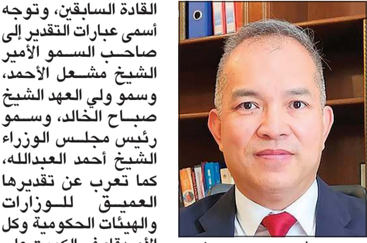
بقلم سفير فيتنام نجوين دوك ثاوغ

قبل ثمانين عاماً، عاش الشعب الفيتنامي لحظة تاريخية فارقة يفخر بها، وعندما وقف الرئيس هو تشي منه في الثاني من سبتمبر عام 1945 ليقرأ «إعلان الاستقلال»، معلناً ميلاد جمهورية فيتنام الديمقراطية، وافتتاح فصل جديد في تاريخ الوطن العزيز.