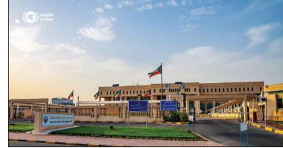
مبنى وزارة الكهرباء والماء والطاقة المتجددة

يومياً ومن سلطنة عمان بواقع 300 ميغاواط يومياً. وقالت إن هذا الاتفاق الذي تستعد الوزارة للبدء يهدف إلى تأمين احتياجات