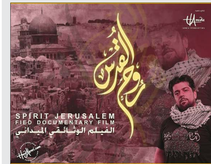
بوستر فيلم «روح القدس»

أعلن المنتج والمخرج حمد النوري مشاركة فيلمه الوثائقي المبدئي الجديد «روح القدس» في فعاليات جائزة سبتي موس الدولية، والتي تقام يومي 3 و4 سبتمبر المقبل، في العاصمة الهولندية (أمستردام). وقال النوري في تصريح صحافي إن الفيلم، وهو إنتاج كويتي بحث، جاء بعد منافسة قوية مع مئات الأفلام المشاركة من مختلف أنحاء العالم، ليصل إلى منصة دولية مرموقة تعكس إبداع الشباب الكويتي وريادتهم الفنية. وأضاف أن المشاركة ليست فنية فقط، بل تحمل رسالة إنسانية لقضية عادلة.