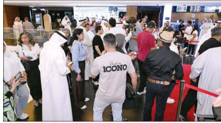
حضور جماهيري وإعلامي في العرض الخاص للفيلم