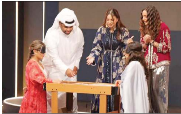
من فقرات البرنامج