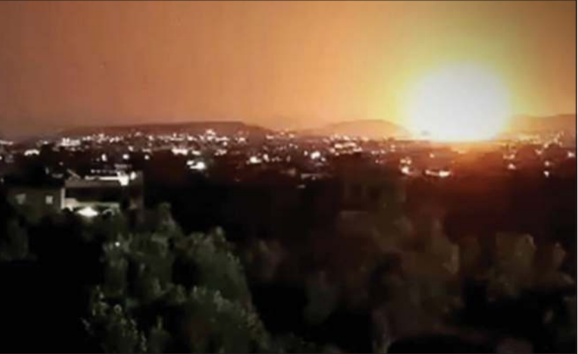
صورة نشرتها وكالة الأنباء السورية «سانا» لهجوم الإسرائيليين

وأفادت وزارة الخارجية السورية حينها عن مقتل 6 عناصر من القوات السورية بالقصف الإسرائيلي لهذا الموقع القريب من مدينة الكسوة في ريف دمشق. من ناحيته، قال المرصد السوري لحقوق الإنسان إن الموقع عبارة عن «مستودع ضخم للصواريخ، كان يستخدم سابقا من قبل حزب الله» اللبناني المدعوم من إيران. وأضاف أنه مساء الأربعاء «حلت 4 مروحيات إسرائيلية على ارتفاع منخفض في منطقة الكسوة بريف دمشق، وهبطت مظلات لمباشرة عملية إنزال وتفتيش في الموقع».